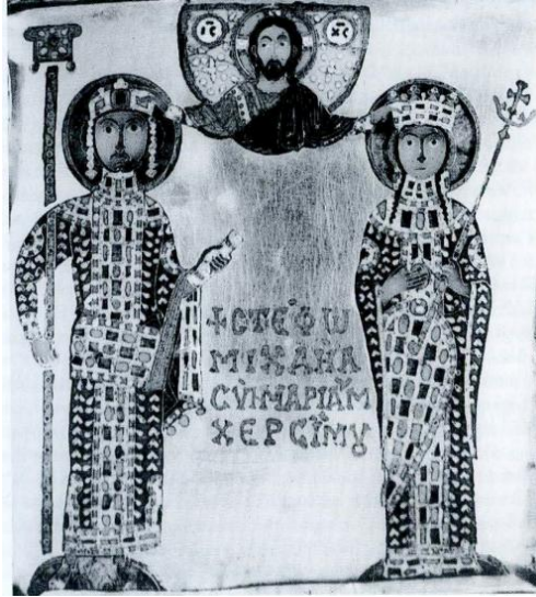
Ek-2: Hahuli İkonunda yer alan Dukas ve Mariam görseli. Bkz. Mikaberidze 2000, s. 196.