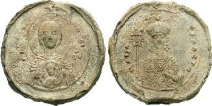
Ek-5. 1070 tarihli Mariam'a ait kurşun mühür örnekleri. Bkz. https://georoyal.ge/?id=963 veya https://kids.kiddle.co/Maria_of_Alania