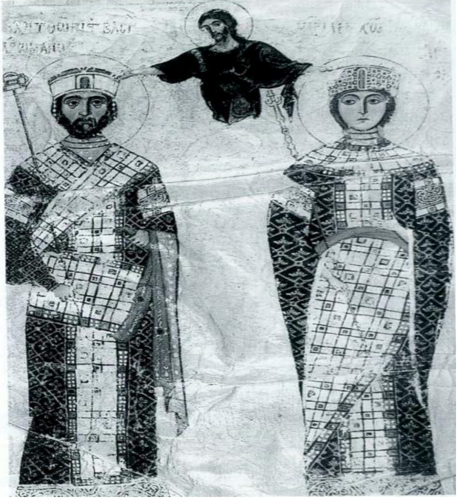
Paris Coislin'deki Aziz İoannes Krisostomos'un Vaazları'nın yer aldığı yazmada geçen Nikephoros Botaneiates ve Mariam'ın görseli Bkz. Mikaberidze 2000, s. 185.