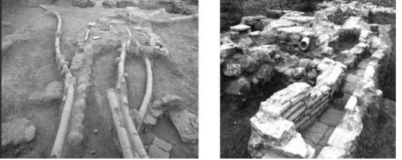
Figür 1. Konut Alanından Elegeçen Künkler (Yaylalı, 2008: Res. 7).

Açmanın içerisinde doğudan batıya doğru uzanan tabanı ve duvarları düzgün tuğlalar ile çevrili kanala ulaşılmıştır. Daha sonra bu kanalın 1 No.lu açma içerisinde tespit edilen 1 No.lu kuyu ile bağlantılı olduğu görülmüştür. Kanalın üzerinin düzgün şekilde kapatılmadığı ve kuyunun özensiz olarak yapılması bu sistemin kanalizasyon olabileceğini akla getirmektedir (Yaylalı, 2007: 264). 1 No.lu kuyuya yaklaşık 6.25 m uzaklıkta aynı mimari üslupta inşa edilen 2 No.lu kuyu açığa çıkarılmıştır. 1 ve 2 No.lu kuyuda görülen özensiz işçilik bu yapıların kanalizasyon ya da atık suların depolanması amacıyla kullanıldığını göstermektedir. Bu yapıların ilerisinde 5 No.lu açma içerisinde kırık olarak 3 adet pithos tespit edilmiştir. Depolama amacıyla kullanılan pithos ların aynı seviyede ele geçmesi ve birbirlerine olan uzaklıklarının yaklaşık 5 m olması aynı dönemde kullanıldığını göstermektedir. Alanda yapılan çalışmalarda pithos ların altında mermer kaide ve kaidenin altında da makalenin konusunu oluşturan köşeleri aslan kabartması şeklinde işlenen diğer kısımlarında ise bitkisel bezemenin yer aldığı plaster başlık ele geçmiştir (Yaylalı, 2007: 565), (Fig. 2).