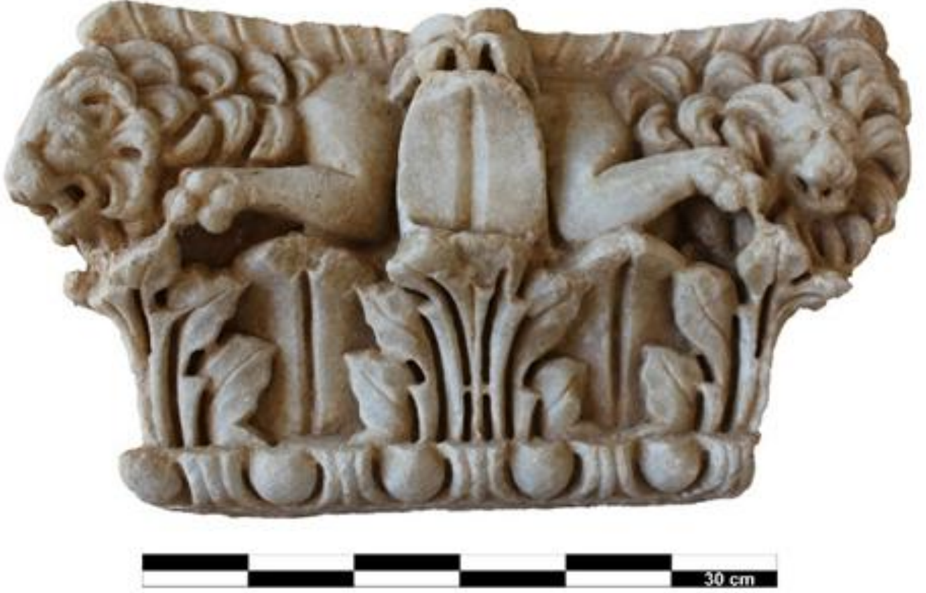
Figür 3. Tralleis Konut Alanından Ele Geçen Figürlü Plaster Başlık

Son derece iyi korunmuş olan başlığın üzerinde zamanla oluşan aşınma dışında herhangi bir tahribat söz konusu değildir. Tek sıra akhantus yaprak çelenginin işlendiği kalathos yüzeyinde yapraklar ion kymation 'unun üzerinden filizlenmektedir. Kalathosun altından yani kalathos zemininden filizlenmeyen akhantus yapraklarının yaprak dilimleri derin kanallar ile gösterilmiştir. Akhantus yaprağının orta kaburga bölümü yan yaprak dilimleri ile ince iplik şeklinde bağlanmıştır. Yaprak dilimleri tek merkezden filizlenmeyip birbirinden bağımsız olarak ion kymationun üzerinden filizlenmektedir. Sarkık üst yaprak, kalathos yüzeyinin ortasına ve köşelerde yer alan iki aslanın arasında işlen dil yaprağa değerek dış bükey kıvrım oluşturmuştur. Yan yapraklar derin kanallar ile orta kaburgadan ayrılmaktadır.