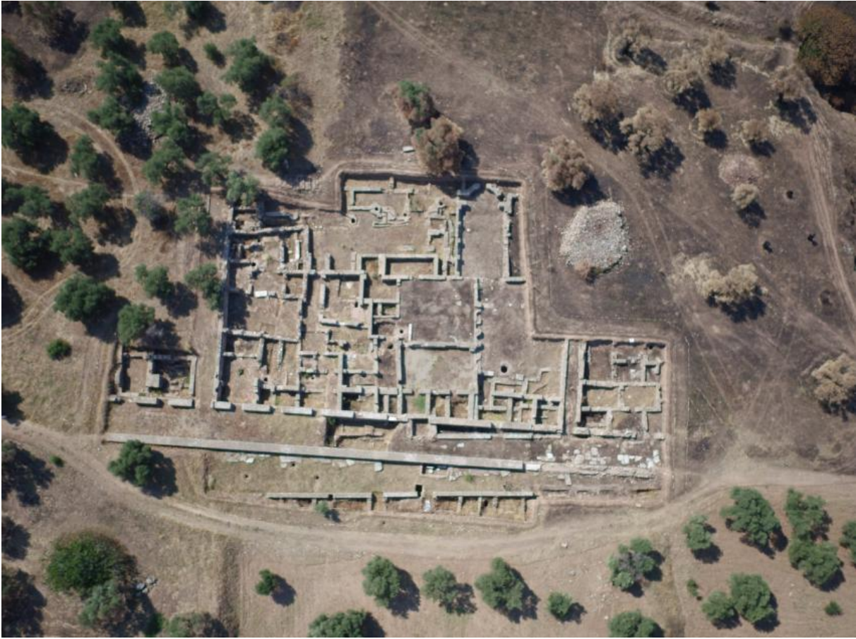
Figür 2. Tralleis Antik Kenti Konut Alanı