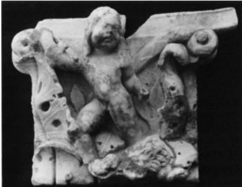
Figür 5. Aphrodisias Kazılarında Ele Geçen 85-182 Envanter Numaralı Plaster Başlık (Dillon, 1997: Fig. 25, B15)

MÖ 5. yüzyıl sonlarında ortaya çıkan ve ilk olarak Bassae Apollon tapınağında uygulanan korinth düzeni (İdil, 1984: 1) MÖ 1. yüzyıl ile birlikte yoğun olarak kullanılmaya başlanmıştır (Öztaner- Koçak, 2022: 93). MS 2. yüzyılda İmparator Hadrianus Dönemiyle birlikte Anadolu'da Pergamon ve Ephesos gibi kentlerde bezeme okullarının stilleri gelişmeye başlamıştır (İdil, 1984: 18). Bu stilden ayrı olarak Helenistik Dönemden itibaren heykeltraşlık konusunda bilinen ve MS 2. yüzyılın ortalarından itibaren Roma sınırları içerisinde tekelleşmeye başlayan Aphrodisias Bezeme Okulu aktif olmaya başlar (İdil, 1984: 27, Kaya, 2018: 22). Tralleis figürlü plaster başlığı stil özellikleri bakımından Aphrodisias Bezeme Okulu özellikleri ile benzerlik göstermektedir. Aphrodisias 1985 yılı kazılarında Tetrasyon'un güney doğusunda bulunan ve 85-182 envanter numaralı (Dillon, 1997: 755) başlık ile benzerlik göstermektedir (Fig. 5).