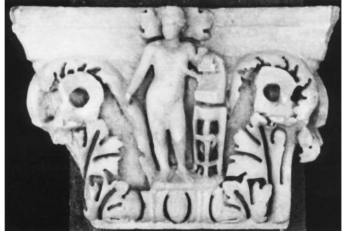
Figür 7. Aphrodisias Kazılarında Ele Geçen 66-87 Envanter Numaralı Plaster Başlık (Dillon, 1997: Fig. 4, A3)

A3 başlığında ise kalathos yüzeyinin merkezinde Tanrı Apollon işlenmiştir. Tralleis figürlü plaster başlığı ile benzerlik figürlerin kalathos zeminin üzerine işlen ion kymationun üstünde işlenmiş olmasıdır (Dillion, 1997: 737), (Fig. 7).