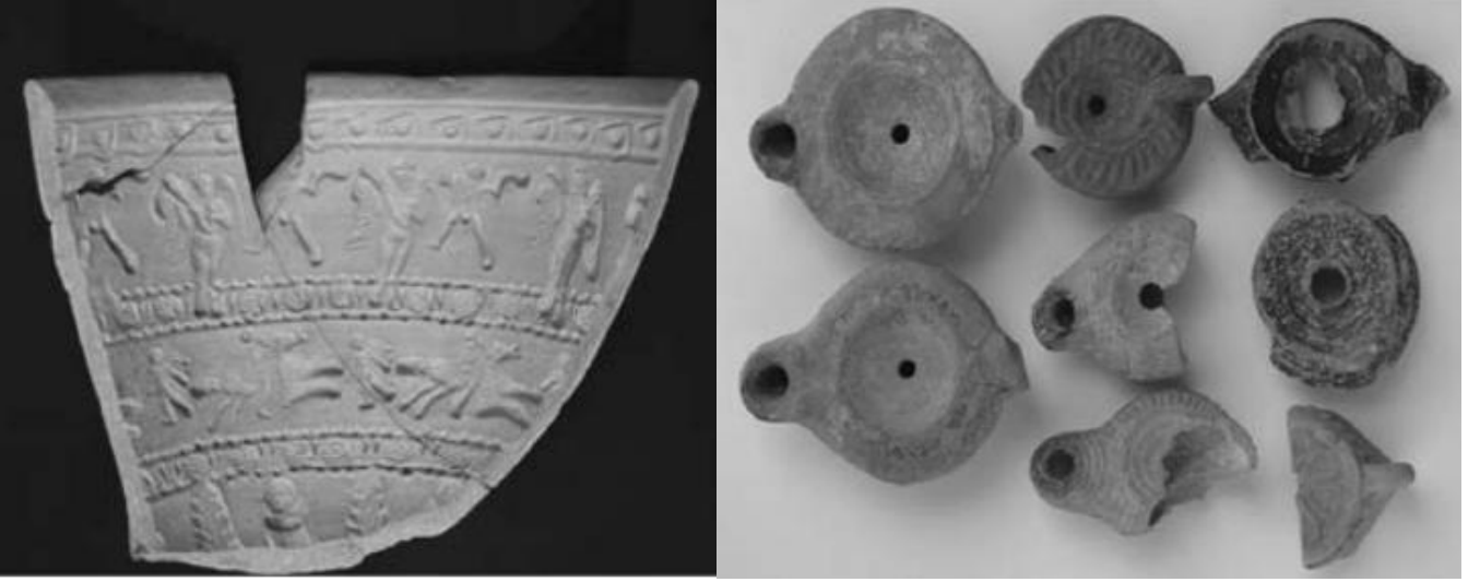
Fig. 8. Konut Alanından Elegeçen Megara Kasesi ve Kandiller (Yaylalı, 2008, Res. 8-9)

2006 yılı Roma Konut Alanında yapılan kazı çalışmalarında, ele geçen plaster başlık, başka bir yapıda kullanılmış olup bulunduğu alanda devşirme olarak kullanılmıştır. (Yaylalı, 2007: 565). Söz konusu başlığın bölgede sık gerçekleşen ve örneğini verdiğimiz depremler ile yıkılan başka bir yapıdan getirilip alanda kullanılmış olması mümkündür. Alanda yapılan kazı çalışmalarında herhangi bir yazıtın ele geçmemesi alanın yapım tarihi hakkında kesin verilerin olmamasına sebep olmaktadır. Ayrıca alanda yapılan kazı çalışmalarından ele geçen Helenistik Döneme tarihlendirilen megara kasesi parçası ve Roma Dönemine tarihlenen kandiller başlığın tarihlendirilmesine yardımcı olmamaktadır (Fig. 8).