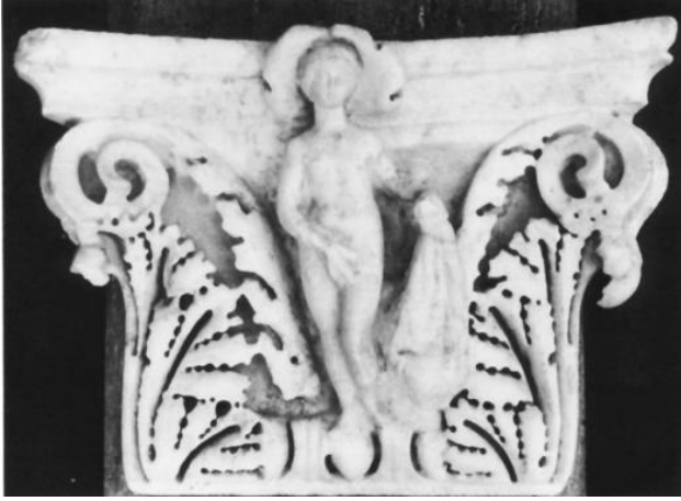
Figür 6. Aphrodisias Kazılarında Ele Geçen 65-442 Envanter Numaralı Plaster Başlık (Dillon, 1997: Fig. 3, A2)

İki parça olarak ele geçen bu başlık üzerinde aslan avı sahnesi yer almaktadır. Yine Aphrodisias'tan ele geçen ve Dillon tarafından birinci grup içerisinde gösterilen A2 ve A3 figürlü plaster başlıkları ile stil özellikleri bakımından benzerdir. A2 başlığı üzerinden ion kymationu üzerinde kalathos yüzeyinin ortasına Aphrodite işlenirken başlığın köşelerinde akhantus yaprakları işlenilmiştir (Fig. 6).