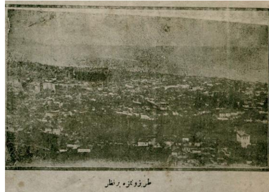
Resim 3: “Trabzon’umuza bir nazar” Genç Anadolu , 16 Şubat 1338/1922, S. 4.

Genç Anadolu bir bakıma mektep dergisi niteliğindedir ki yazılan yazıların çoğunluğunun eğitim içerikli olması da bu durumu kanıtlıyordu. Eğitim sorunları, gençlerin eğitimi ve terbiyesi ve eğitimde reform yapılması derginin başlıca meselelerindendi. Nitekim, K. Yust, Samsun'da çıkan Işık [1918-1919] dergisini, bu yönüyle Genç Anadolu dergisine benzetmişti (K. Yust, 1995, s. 57'den aktaran; Öksüz, 2023, s. 183). Genç Anadolu dergisinin amacı her bakımından sağlıklı gençler yetiştirmektir. Sayfalarında yayımladığı yazılarda bu hususa özellikle dikkat ediyordu. Gençliğin seviye ve