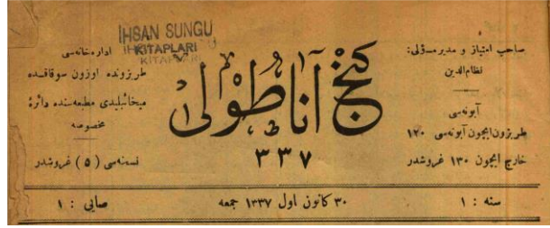
Resim 1: Genç Anadolu 'nun başlık klışesi

Genç Anadolu dergisi yayın türü açısından oldukça çeşitliydi. Fikrî, ziraî, fennî, ilmî, edebî, tarihî, eğitim ve spora ait yazılar derginin sayfalarında kendine yer buluyor, hâl böyle olduğu için dergi farklı çevrelerden okur da çekebiliyordu. Dergi aynı zamanda İstanbul'dan da takip ediliyordu. Hazine-i Maliye ve Duvun-ı Umumiye Dava Vekili Salih Zeki'nin dergiye gönderdiği bir yazıdan bu anlaşılıyordu. Salih Zeki, dergiyi takip edip istifade ettiğini söyledikten sonra arkadaşlarının da Genç Anadolu 'ya alaka gösterdiklerinden bahsediyordu: “Mecmuanızı bunca meşagül arasında dikkatle takip ediyorum. Güzel, istifade-bahş [istifade dilen] bir mecmua. Alehusus fennî aksamından müstefit oluyorum. Bizim çocuklar da mecmuaya fazla alaka gösteriyorlar” (Salih Zeki, 1922, s. 12). Genç Anadolu dergisinde çıkan bir haberden Ahmet Ağaoğlu'nun da dergiyi beğendiği anlaşılıyordu. Ahmet Ağaoğlu, 1919 yılında İngilizler tarafından Malta'ya