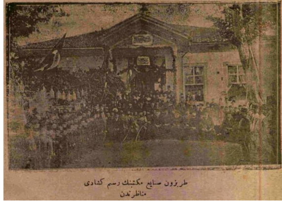
Resim 2: “Trabzon Sanayi Mektebinin resm-i küşadı menazırından”

Genç Anadolu dergisi 1921’in sonlarında yani Millî Mücadele senelerinde yayın hayatına başlamıştı. Bu yıllar özellikle Birinci Dünya Savaşı’nın yarattığı bunalım neticesinde buhran yılları olarak tarihteki yerini almıştı. Dört yıl süren Birinci Dünya Savaşı ve öncesindeki Trablusgarp ve Balkan Harbi her alanda zafiyet meydana getirmiş, bu zafiyetler ise bilhassa ahlâk üzerinde tesirini göstermişti. Birinci Dünya Savaşı’nın yarattığı ağır ekonomik tahribat hemen her alanda kendini göstermiş, çoğu ürüne ulaşım son derece zor hâle gelmişti. Ekonomik sıkıntıların hissedilmediği neredeyse hiçbir yer kalmamıştı. Mat-