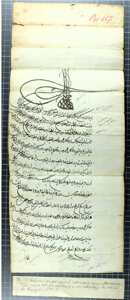
Ek 1. Bosna Beylerbeyine hitaben yazılan 1588 tarihli III. Murad dönemine ait ferman. OZHAD D.117.