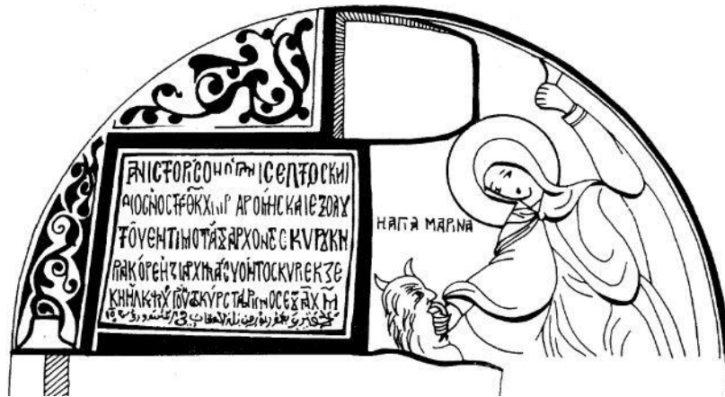
Görsel 9. Azize Marina'nın Şeytanı yenmesi sahnesinin çizimi, Sinop Balatlar Kilisesi güney giriş lüneti çizimi, 17. yüzyıl.

Şeytan ve kötü ruh tasvirleriyle karşılaşılan duvar resimlerinin yanı sıra günlük yaşama ait diğer önemli bir obje grubu olan koruyucu (apotropaik) nitelikli tılsım takılar üzerinde de özellikle kötü ruhun yok edilmesi sahneleriyle karşılaşılmaktadır. Geç Roma ve Bizans dönemi tılsımları üzerinde kötü ruhun