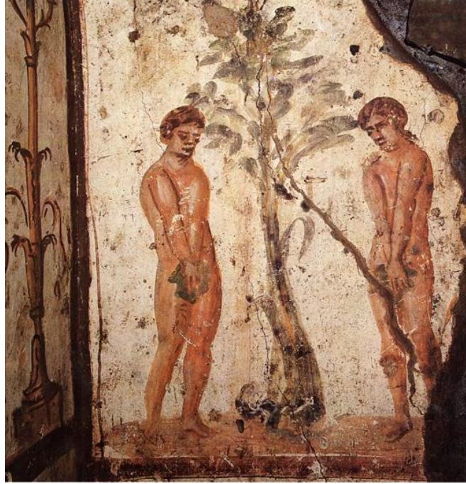
Görsel 1. Cennet bahçesinden Âdem ve Havva'nın kovuluş sahnesi, Petrus ve Marcellinus Katakompu, Cubiculum XIV, Roma, 4. Yüzyıl.

2000, s. 33-39). 15- 16.yüzyıldan itibaren buradaki dişi şeytan Adem'in ilk eşi olduğuna inanılan zamanla kötücül bir varlığa dönüştüğü kabul edilen Lilith'tir. Tanrıya ve Adem'e olan kızgınlığı sonucu Havva'yı yasak ağacın meyvesini yemesi için kandırıp Âdem ile Havva'nın cennetten kovulmasına sebep olmuştur (Görsel 1). Şeytanın ve kötü ruhların şekil değiştirdiği bilinmektedir. Âdem ile Havva'nın "İlk Günah" sahnelerinde olduğu gibi şeytan benzer şekilde yılan, ejderha, aslan, akrep ve baykuş biçiminde düşünülmüş ve tasvir edilmiştir. 586 yılına tarihlenen Rabbula İncili'nde de yılan kötülüğü temsil etmek için betimlenmiştir.