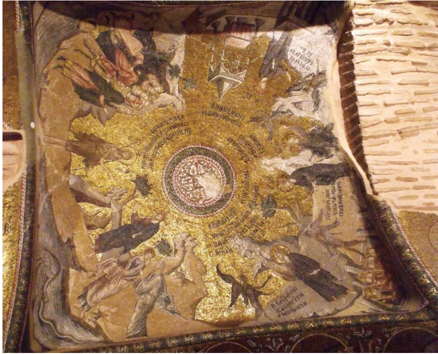
Görsel 4. Şeytanın İsa'yı üç kez denemesi sahnesi, Khora Manastır Kilisesi (Kariye Camisi) İç narteks 14. yüzyıl.

İsa'nın pek çok farklı hastalıktan muzdarip kişileri iyileştirmesi ve ölüleri diriltmesi mucizelerinin yanı sıra içine cin girdiği için delirenlerin iyileştirilme sahneleri Orta ve Geç Bizans dönemi dini