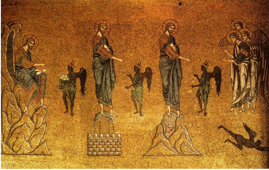
Görsel 3. Şeytanın İsa'yı üç kez denemesi sahnesi, Venedik San Marco Kilisesi, 12.yüzyıl.