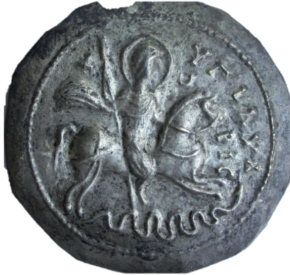
Görsel 10. Kutsal Binici'nin yılan biçimindeki şeytanı öldürmesi tasvirli, üzerinde Hygeia (sağlık) ve Kharis (iyilik) yazan Bizans döneminden gümüş tılsım, Silifke Müzesi, 2404 env. no.

yenilmesi sahnesinin yanı sıra haç, figür, şekil ve yazılarla karşılaşılmaktadır. Bunların aracılığıyla şeytan ve kötü ruhlar korkutulup kaçırılmak, nazarın yıkıcı etkisinden ve hastalıklardan korunmak istenmiştir (Dickie, 1995, s. 12- 14). Bu figür ve şekillerin bir kısmı Roma, Mısır, Mezopotamya ve İran'daki dinlerde daha eski dönemlerde kullanılmışlardır. Özellikle 5- 7. yüzyıllar arasına tarihlenen tılsım örneklerinde sıkça karşılaşılan bir diğer tasvir de şeytan ve kötü ruhları Tanrının kendisine bağışladığı mühür sayesinde etkisiz hale getiren Tevrat Peygamberi Süleyman ya da kötü ruhları yok etmiş olan Aziz Sisinnios olup atının toynakları altında tüm kötülöklere (nazar, hastalık ve düşük) sebep olarak görölen dört ayaklı hayvan, ejderha, yılan veya göğüsleri ve uzun saçları açık kadın şeklinde gösterilmiş kötölöğü simgeleyen dişi kötü ruhu (Vikan, 1984, s. 9, not 89.) 11 ya da yılanı haçlı mızrağıyla öldürerek yenmiş olarak gösteren kompozisyonlardır (Vikan, 1991, s. 941) (Görsel 10). Bazı örneklerde kutsal biniciye Baş melek Mikail ve bazen de Rafael önderlik etmektedir. Özellikle Orta Bizans döneminden itibaren duvar resmi ve tılsım takılarda, Ortodoks inancın büyük önem verdiği Georgios, Theodoros Stratelides, Theodoros Tiron ya da Demetrios gibi at üzerinde düşmanı mızrağıyla öldüren asker aziz tasvirlerinin yaygınlaştığı göze çarpmaktadır.