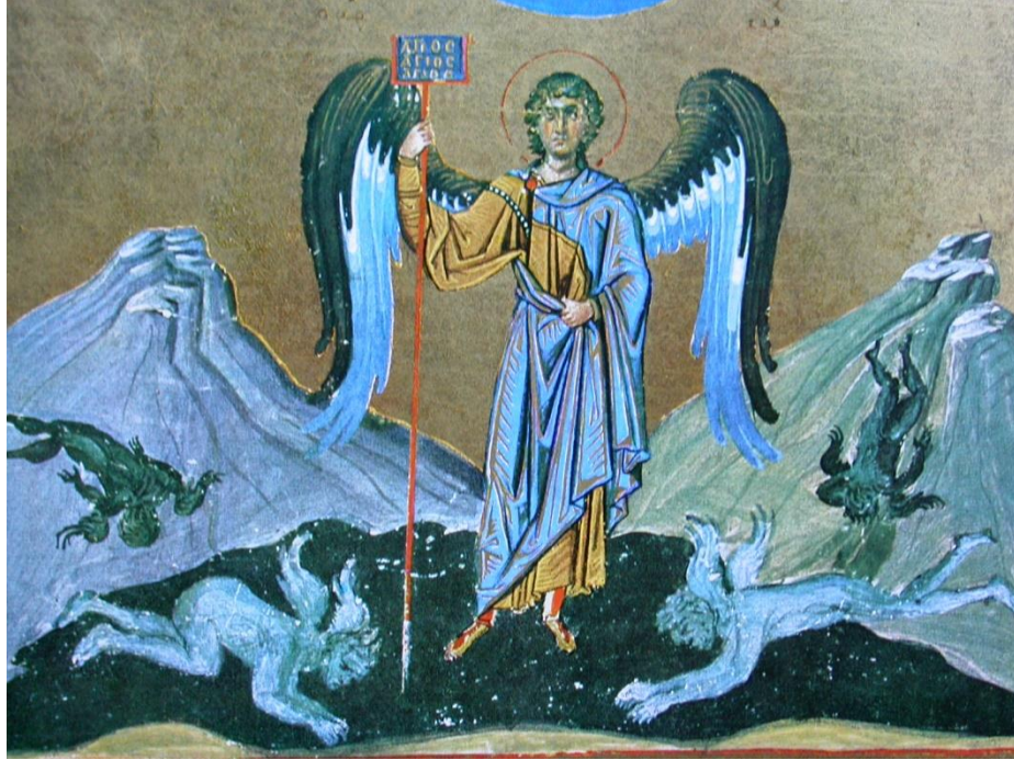
Görsel 11. Bir Bizans minyatüründe şeytanı yenmiş, kötü ruhlarla baş eğdirmiş baş melek Mikail, II. Basil Menelogion'u MS Graec. 1613, Roma, Vatikan Kütüphanesi.

Baş melek Mikail'in de şeytanı yakalaması, mızraklayarak yenmesi sahnelerine duvar resimleri, ikona ve el yazmaları yanı sıra tılsım takılar üzerinde de sıkça rastlanmaktadır (Görsel 11).