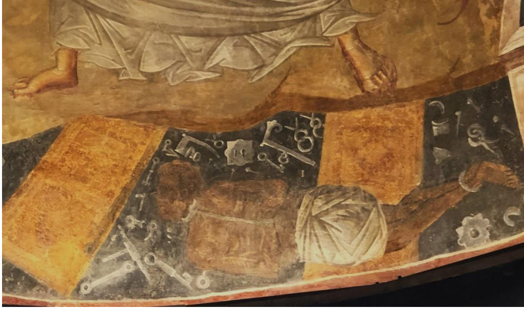
Görsel 6. Hades ve cehennemin kırık kapıları, Khora Manastır Kilisesi Mezar Şapeli apsisten ayrıntı, 14. yüzyıl.

şeytan ve kötü ruhlar gibi kompozisyondaki diğer kutsal kişilerden daha küçük boyutlu siyah, koyu mavi veya kahverengi ten rengine sahip kabarık ve dağınık bazen siyah, bazen de beyaz saçları olan vücudunun sadece mahrem yerleri örtülü diğer kısımları çıplak yaşlı, kaba görünümlü bir erkek olarak gösterilmiştir 10 (Görsel 6).