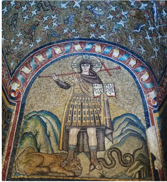
Görsel 2. Zafer kazanmış İsa tasviri, Ravenna'daki Baş Piskoposlar Şapeli, 6.yüzyıl ortaları.

Orta Çağ Hristiyan dünyasında hem Batı hem de Doğu'da üretilmiş olan resimlerde özellikle 9. yüzyıldan itibaren şeytan ve diğer kötü ruhların tasvirlerinde artış olmuştur. Bu dönemden itibaren şeytanın tasvir edildiği sahneler içinde en yaygın hale geleni Yeni Ahit'teki İsa'nın vaftizden sonra çölde şeytan tarafından üç kez denenmesi/ sınanması ya da ayartılmaya çalışılması olmuştur. 9- 15. yüzyıllar arasında Batı ve Doğu ve kiliselerinin resim programında bu sahne sıkça yer almıştır (Görsel 3).