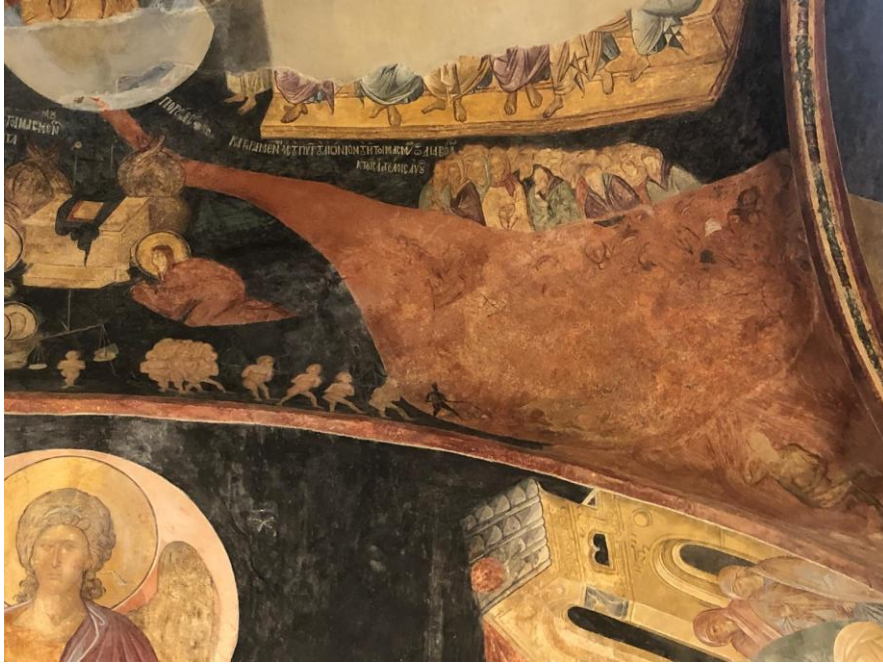
Görsel 7. Son Yargı, Günahların tartılması ve lanetlilerin cehenneme gidişine önderlik eden kötü ruhlar, Khora Manastır Kilisesi Mezar Şapeli tonoz resmi (Kariye Camisi), 14. yüzyıl.

şeytan figürü gibi yaşlı, dağınık saç ve sakalları olan diğer kötü ruhlara göre daha iri olarak gösterilmiş, tahtta oturan cehennem zebanisiyle aralarda siyah minik kötü ruhlar sıklıkla tasvir edilmişlerdir (Görsel 7). Bu bağlamda Anastasis de etkisiz hale getirilen Hades ya da Şeytan'ın son yargıdan sonra tekrar cehennemdeki krallığına geri dönmüş olarak betimlenmiştir.