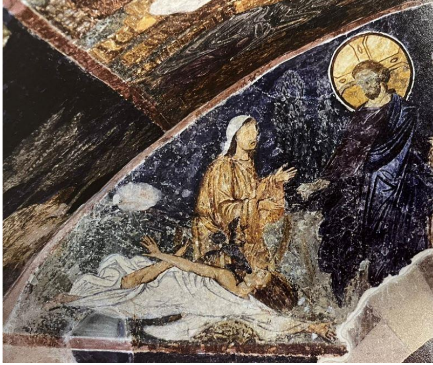
Görsel 5. Kenanlı kadının kızının içindeki cinin çıkarılarak iyileştirilmesi sahnesi, Trabzon Ayasofyası, 13. yüzyıl.