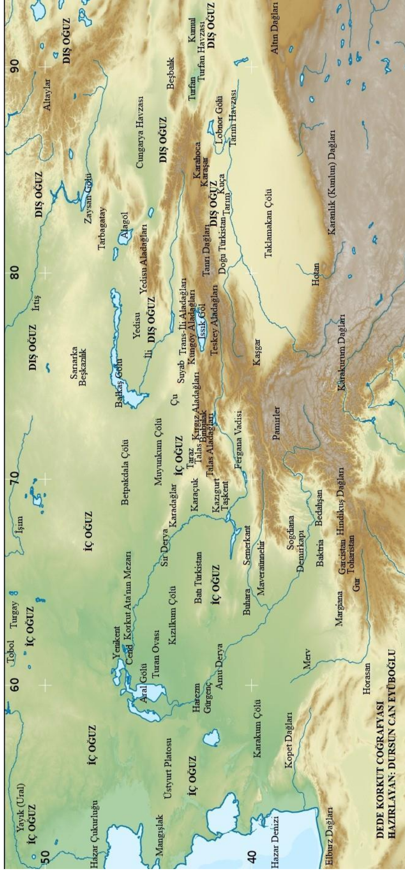
DEDE KORKUT COĞRAFYASI HAZIRLAYAN: DURSUN CAN EYÜBOĞLU