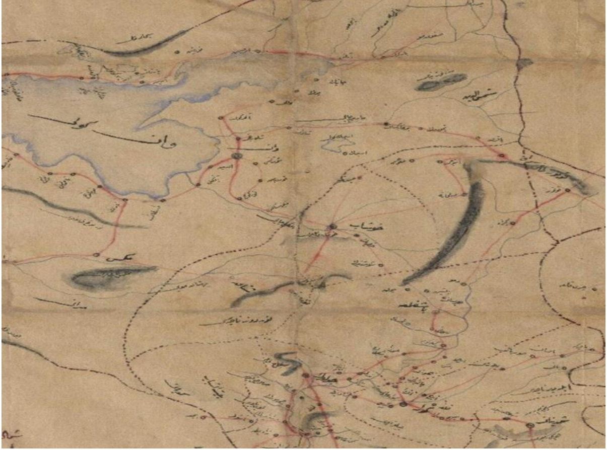
Ek 1: Osmanlı Dönemi Harita