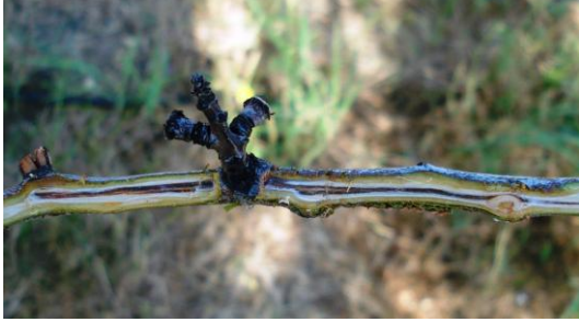
ŞEKİL 6. Hastalıklı badem dallarındaki çizgisel nekrozlar.

etmenin (fungus, bakteri vb.) belirtilerine (kanser, yanıklık, akıntı, fruktifikasyon organı vb.) rastlanmamaktadır. Ancak dalın boyuna kesiti alındığında meyvenin dala bağlandığı yerden öze doğru ilerleyen, siyaha yakın koyu renkli, çizgisel lekeler belirgin olarak görülmektedir (Şekil 6).