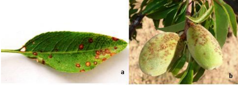
ŞEKİL 3. Yaprak delen hastalığının yapraktaki (a) ve meyvedeki (b) belirtisi.