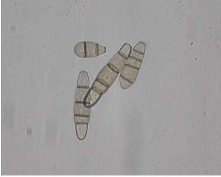
ŞEKİL 4. Wilsonomyces carpophilus 'un konidisi.

Etmen, bazı bahçelerde yoğun gözlemlense de hastalık şiddeti ekonomik boyutlarda değildir. Diğer hastalıkların aksine en düşük enfeksiyonlar %2.05 yakalanma oranı ile Senirkent'te gerçekleşmiş, Keçiborlu (%15.60), Eğirdir (%17.24) ve Yalvaç (%16.67)'ta ise yakalanma oranları bir birine yakın bulunmuştur (Çizelge 6). Senirkent'te yakalanma oranının düşük bulunmasında, etmenin nispeten düşük sıcaklık isteğine (Adaskaveg 2002) karşın, ilçede sıcaklık ortalamalarının diğer ilçelere oranla daha yüksek oluşu neden olabilir.