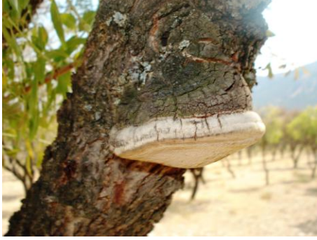
ŞEKİL 5. Phellinus tuberculosis 'un basidiokarpı.

Odun çürüklüğüne neden olan P. tuberculosis Isparta ili badem bahçelerinde ciddi enfeksiyonlara neden olmaktadır (Sekil 5). Yakalanma oranlarının, P. ochraceum ile paralellik gösterdiği dikkat çekmektedir. En yüksek değerlere Senirkent'te (%48.96) ulaşılmış, onu Keçiborlu (%33.65) ve Eğirdir (%9.72) takip etmiştir (Çizelge 6). Etmene Yalvaç ilçesinde rastlanılmamıştır. Sekonder bir patojen olduğu düşünüldüğünde, etmenin en yoğun Senirkent'te bulunmasının nedeni olarak, bahçelerinin daha bakımsız ve et lekesi hastalığının ilçede çok şiddetli enfeksiyonlara neden olması gösterilebilir.