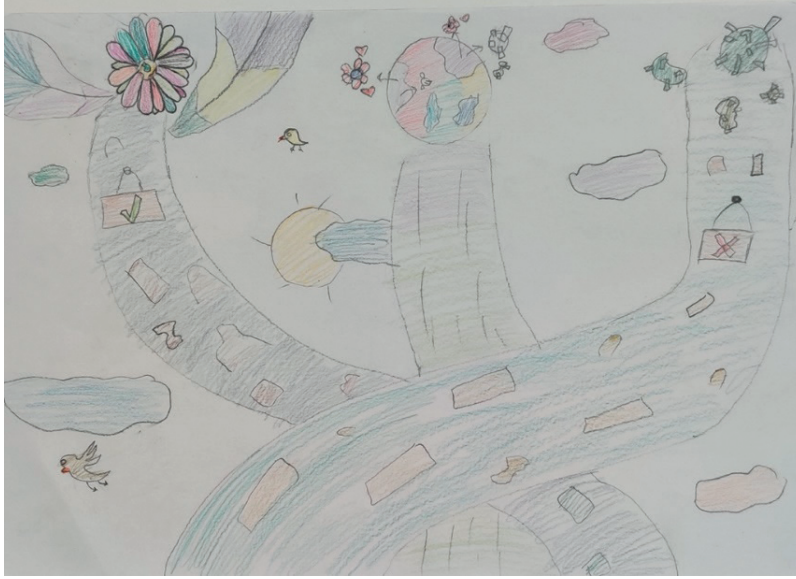
Şekil 4. Üst sosyo-ekonomik düzeydeki K4 kodlu öğrencinin yol konulu çalışması

ancak çalışmasında bu duyguyu yansıtmadığı gözlemlenmiştir. Bu bağlamda yapılan bu resim çalışması görüntüsel gösterge kapsamında değerlendirilmiştir