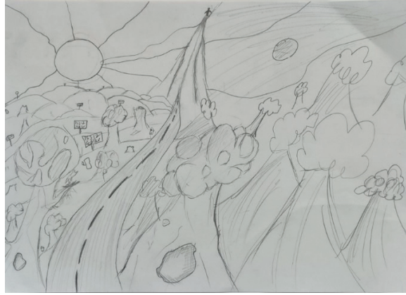
Şekil 7. Üst sosyo ekonomik düzeydeki E3 kodlu öğrencinin doğa konulu çalışması

Yukarıda yer alan Şekil 6’da alt sosyo-ekonomik düzeydeki okul öğrencisine ait çalışma görülmektedir. Bu çalışmada, doğada iki figür görülmekte ve bu iki figürün üzerinde kan göstergesi görülmektedir. Figürlerin yüz ifadelerinde acı çektiklerini belirten mimikler görülmektedir. Kan göstergesi, yaralanma ve tehlikede olmanın belirtisi olarak ön plana çıkmaktadır. Öğrenci; “Ben ve arkadaşım doğadayız piknik yapıyoruz. İki tane ağaç çizdim. Bir tane güneş iki tane bulut çizdim. Bize aslan saldırdı ve ben de aslanı kaldırıp yere vurdum. Aslan kaçmaya başladı. Doğa vahşidir bu yüzden.” diye ifade etmiştir.