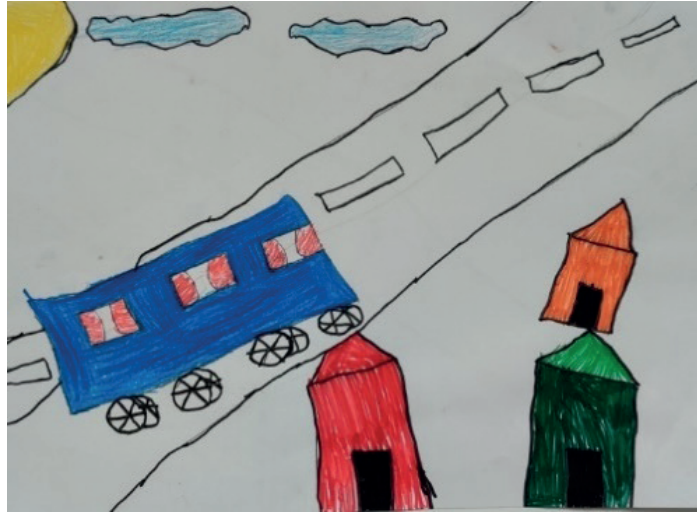
Şekil 3. Alt sosyo-ekonomik düzeydeki E15 kodlu öğrencinin yol konulu çalışması

Yukarıdaki Tablo 1'e dayanarak öğrencilerin yüksek oranda yalnızca görüntüsel gösterge kullandığı görülmektedir. Alt sosyo-ekonomik düzeydeki öğrencilerin, üst sosyo-ekonomik düzeydeki öğrencilerden daha fazla görüntüsel gösterge tercih etmesi dikkat çekmektedir. Simge kullanımında ise üst sosyo-ekonomik düzeydeki öğrencilerinin bu gösterge türünü daha sık kullandığı görülmektedir. Alt sosyo-ekonomik düzeydeki okulda 3 öğrenci belirti kullanırken, üst sosyo-ekonomik düzeydeki okulda bu türü kullanan öğrenci sayısı 1'dir. Üst sosyo-ekonomik düzeydeki öğrencilerin 22%'si görüntüsel gösterge, belirti ve simgeyi birlikte kullanırken, alt sosyo-ekonomik düzeydeki öğrencilerinin yalnızca 6%'sı bütün gösterge türlerini bir arada kullanmıştır. Tablo 1'deki en çarpıcı bulgu, sembolik anlam kullanan öğrencilerin çoğunluğunun üst sosyo-ekonomik düzeydeki öğrencilerden oluşmasıdır. Bunun nedeni, bireyin kültürel çevresi, yaşam koşulları, ailenin kültürel yapısının etkili bir faktör olduğu düşünülebilir. Bu bireyin kültürel çevresinin göstergeleri anlamlandırma ve yorumlamada önemli bir rol oynadığını göstermektedir. Öte yandan, belirti kullanımında alt sosyo-ekonomik düzeydeki öğrencilerin sayıca daha fazla olması, aynı gruba ait üyelerin göstergeleri anlamlandırma sürecinde benzer süreçleri takip ettiğini desteklemektedir.