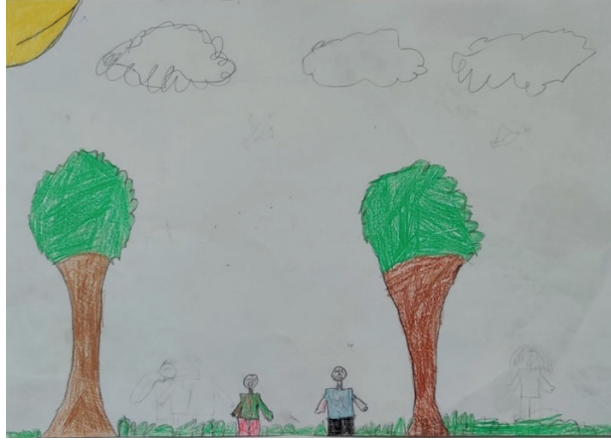
Şekil 6. Alt sosyo ekonomik düzeydeki E16 kodlu öğrencinin doğa konulu çalışması

Yukarıda yer alan Şekil 6’da alt sosyo-ekonomik düzeydeki okul öğrencisine ait çalışma görülmektedir. Bu çalışmada, doğada iki figür görülmekte ve bu iki figürün üzerinde kan göstergesi görülmektedir. Figürlerin yüz ifadelerinde acı çektiklerini belirten mimikler görülmektedir. Kan göstergesi, yaralanma ve tehlikede olmanın belirtisi olarak ön plana çıkmaktadır. Öğrenci; “Ben ve arkadaşım doğadayız piknik yapıyoruz. İki tane ağaç çizdim. Bir tane güneş iki tane bulut çizdim. Bize aslan saldırdı ve ben de aslanı kaldırıp yere vurdum. Aslan kaçmaya başladı. Doğa vahşidir bu yüzden.” diye ifade etmiştir.