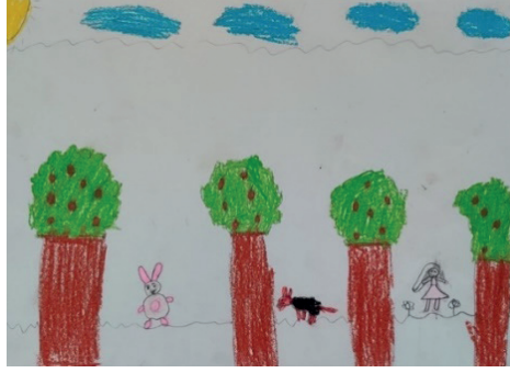
Şekil 8. alt sosyo ekonomik düzeydeki K14 kodlu öğrencinin doğa konulu çalışması

kuraklık ve kötülük simgesini; ormanlık alan iyilik ve bereket simgesini; dağ göstergesi yücelik simgesini; yol göstergesi Tanrı'nın gittiği yol simgesini temsil ettiği anlaşılmaktadır. Ayrıca Tanrı göstergesinin bütün zıtlıkların yaratıcısı olarak ele alındığı tespit edilmiştir.