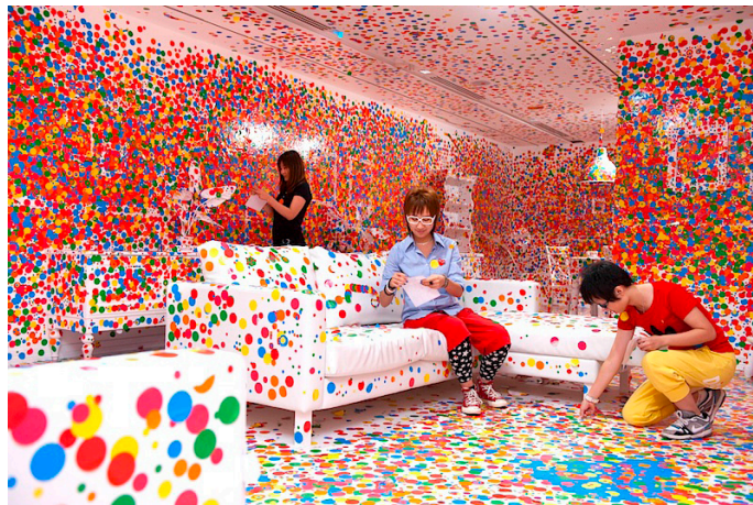
Görsel 5: Yayoi Kusama, “Obliteration Room (Yok Oluş Odası) İçten Görünüş”, 2015, New York, David Zwirner Sanat Galerisi.