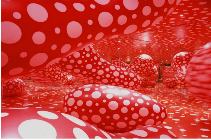
Görsel 9. Yayoi Kusama, “Polka Dot Madness, (Polka Nokta Çılgınlığı)”, 2016, Louisiana Modern Sanat Müzesi, Danimarka.

Sanatçının çocukluğundan beri sürekli tekrarlayan halüsinasyonlarından kaynaklı ortaya çıkan ve sonsuz olarak devam eden imgelerin bu eserde heykelsi yapılarla bütünleştiği görülmektedir. Benliğin sınırlarının eritildiği bu çalışmada birbirini tekrarlayan biçimler uzaysal bir alan içinde kaybolmakta, boşluk ve doluluk iç içe girmektedir. Kütlesi ve hacmi önceden beri bilindik olan bu mekân bu eser ile girdiği ilişki sayesinde sınırsızlaşmakta, ezberde olan boyutları bir anda kimliğini kaybetmektedir. Bu çalışma eser-mekân ilişkisi açısından ele alındığında bir eserin bilindik mekan kurgusunu nasıl da değiştirebileceğine iyi bir örnektir.