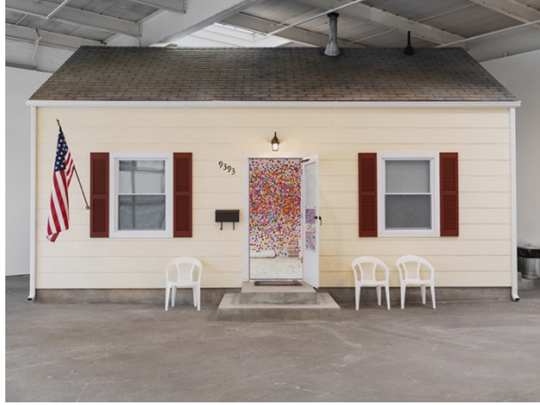
Görsel 3: Yayoi Kusama, “Obliteration Room (Yok Oluş Odası) Dıştan Görünüş”, 2015, New York, David Zwirner Sanat Galerisi.