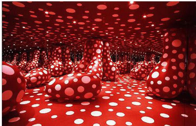
Görsel 8. Yayoi Kusama, “Polka Dot Madness, (Polka Nokta Çılgınlığı)”, 2011- 12, Tokyo Modern Sanat Galerisi, Japonya.

Yayoi Kusama farklı ülkelerdeki müze ve galerilerden gelen davetler üzerine aynı çalışmayı farklı yerlerde ve farklı zamanlarda uygulamıştır. Görsel-8’de yer alan “Polka Nokta Çılgınlığı” adlı çalışma 2011-12 yıllarında Japonya’nın Tokyo Modern Sanat Galerisinde sergilenmiştir. Aynı çalışma 2016 yılında da Danimarka’da Louisiana Modern Sanat Müzesi’nde gerçekleştirilmiştir (Görsel 9).