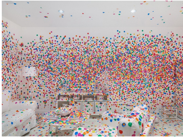
Görsel 4: Yayoi Kusama, “Obliteration Room (Yok Oluş Odası) İçten Görünüş”, 2015, New York, David Zwirner Sanat Galerisi.