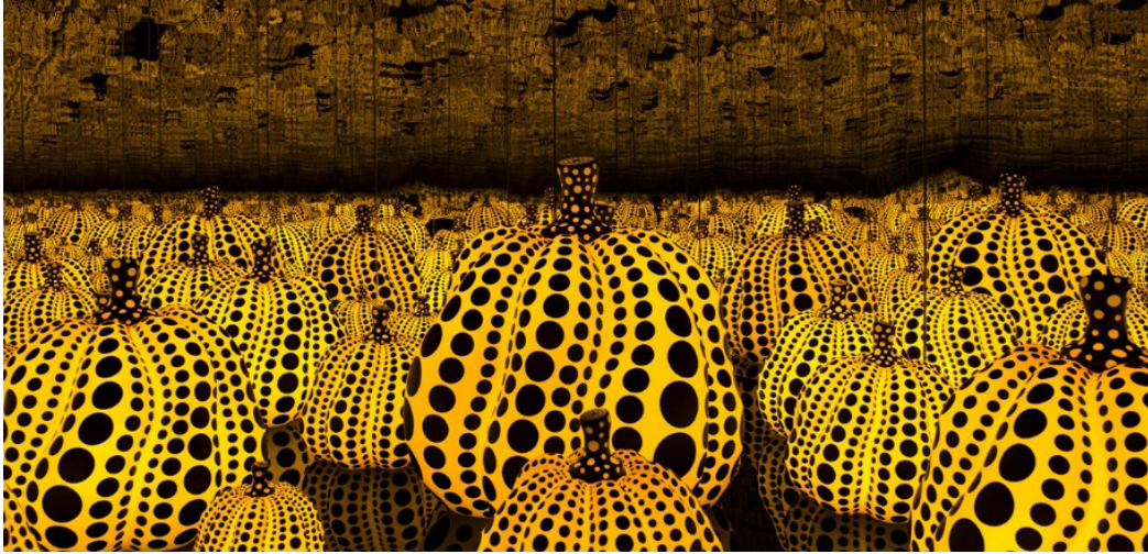
Görsel 6. Yayoi Kusama, “All the Eternal Love I Have for the Pumpkins (Balkabaklarına Sahip Olduğum Tüm Sonsuz Sevgi)”, 2016, Ahşap, Aynalar, Plastik, Cam ve LED’ler. Sanatçının Kendi koleksiyonu. Ota Fine Arts, Tokyo.

“Yayoi Kusama’nın kabakları, sanatçının çocukluk anılarında derinden yerleşmiş düşüncelerinin merkezinde yer alıyor. Bu görsel form, sanatçının pratiği boyunca kapsamlı ve tutarlı bir şekilde öne çıkan bir mecaz. Kabak imgesi ilk kez 1940’larda sanatçının Kyoto Belediye Sanat ve El Sanatları Okulu’nda nihonga (Japon tarzı resim) eğitimi sırasında, sadece eskizlerde tasvir edilerek ortaya çıktı. 1980’ler ve 1990’lardan beri ise sanatsal üretimine resmen yerleşmişler ve Kusama’nın kabaklara olan düşkünlüğü en ufak bir azalma göstermedi” (Sanal-1, 2023).