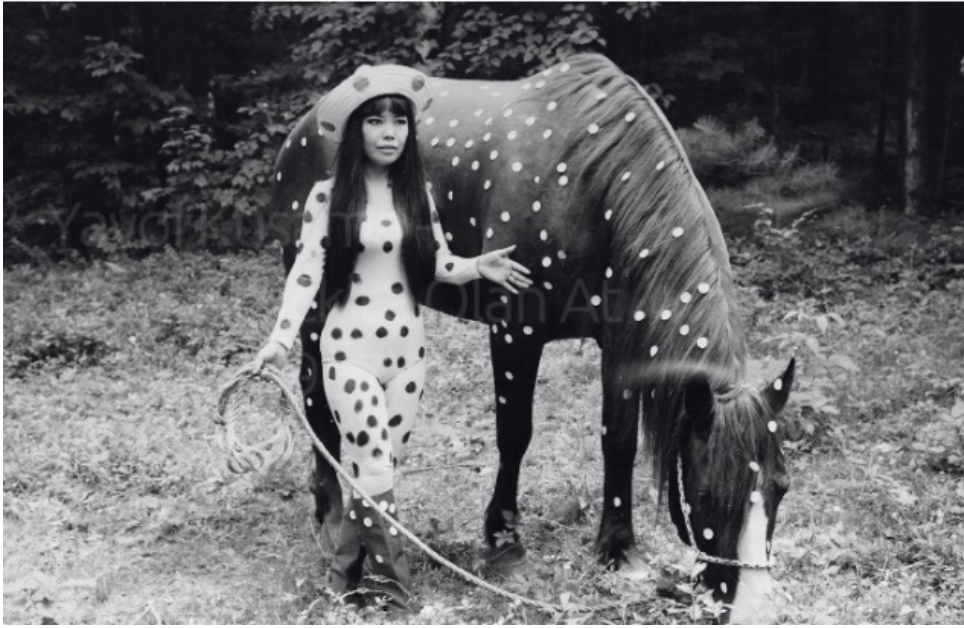
Görsel 1: Yayoi Kusama, "Woodstock Festivali'nde At Oyunu", 4 Temmuz 1967.

Japonya'da var olan geleneksel bakış açısına göre kariyer yapması hoş karşılanmayan Kusama bu sıkıcı ortamda iken bir de ailevi baskı ile karşılaşmıştır. Bu engelleri sanatla aşmaya çalıştığı dönemlerde yavaş yavaş sanat camiasında adı duyulmaya başlanmıştır. Açtığı sergilerin ilgi görmesi, dergilerde yer alması ve eleştirmenlerin övgüleri üzerine Kusama basın da ilgisini çekmiştir. 1957 yılında Amerika'ya giden sanatçı orada da etkili sergiler açmaya başlamıştır. "New York deneyimi Kusama'nın pratiğinde olağanüstü bir devrim yaratacaktı. Daha önce mürekkep, pastel ve suluboya spontane, küçük boyutlu çalışmalar yaparken, şimdi kendini yağlıboya ile cüretkâr, Soyut Dışavurumcu ölçekte, tamamlaması günler, geceler süren saplantılı ve destansı, çok emek gerektiren çalışmalar yaparken bulacaktı. Bunu Jackson Pollock ya da akranları gibi resim yaptığı için tercih etmiyordu. Eserleri tasarımsal açıdan baştan aşağı farklıydı. Kusama'ninkiler Soyut Dışavurumcu ressamların sıcak, dinamik, jestle dayalı çizgilerden uzaktı. Fırça darbelerinin "sonsuz tekrarlayan ritmi" ile "soğuk" bir estetiğe sahipti" (Shore, 2023, s.38).