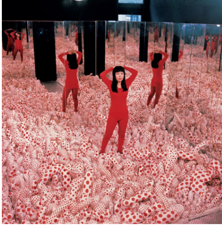
Görsel 2: Yayoi Kusama, “Infinity Mirror Room (Phalli’s Field), (Sonsuzluk Aynalı Oda)”, 1965.

1960’lı yıllar onun sanat yaşamındaki en yoğun süreçlerden biri olmuştur. Avrupa ve Amerika’da çeşitli sergi, etkinlik ve bienallerde mekik dokuyan sanatçı, eserlerine ‘sonsuzluk’ imgesi gibi yeni ve aktif çalıştığı temalar katmaya başlamıştır. Aynı zamanda vücut sanatı ve happening gibi sanat türevleriyle performanslar veren sanatçı puantiyeleri bu alanlarda da kullanmıştır (Görsel 2). Kusama 1970’li yıllarda Amerika’da halka açık gösterilere başlamış ve hippilerle buluşup performans sanatı yapmıştır. Bu gösteriler arttıkça sanatçı hippie hareketinin liderlerinden biri olarak tanınmaya başlanmıştır. Her şeyi puantiyelerle kuşatmaya çalışan sanatçının çocuklukta halüsinasyonlarını bu sanat eserleri yolu ile gerçekleştirmiş ve topluma da gösterebilmiştir.