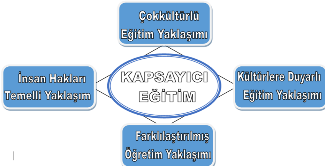
Şekil 2. Kapsayıcı eğitim yaklaşımları

Kapsayıcı eğitim son dönemlerde birçok ülkenin eğitim sistemi üzerinde en çok durduğu konulardan biridir. Kapsayıcı eğitim sadece özel eğitim alanındaki öğrencilerle ilgili bir konu değildir. UNESCO'ya göre kapsayıcılık, öğrenme süreçlerine, topluma ve kültüre katılımın artırılması; eğitimdeki ayrımcılıkların ve dışlamaların azaltılması sürecidir. (UNESCO, 2011). Kapsayıcı eğitime yönelik farklı yaklaşımlar Şekil 2'de gösterilmiştir (Sarı ve Turhan Türkan, 2019):