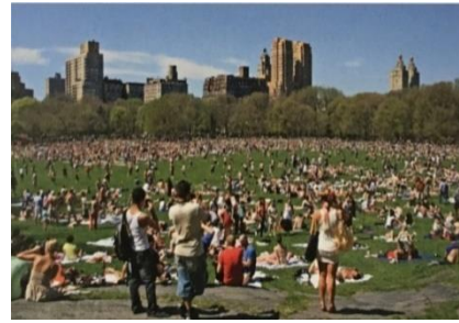
Şekil 3. Central Park- yüzyıllar sonra aynı bölgenin kullanımının devamlılığına bir örnek (Garvin, 2011)

Bu dönemde yağmur suyu değerlendirme, ekosistemi iyileştirme, biyolojik çeşitliliği destekleme, doğaya uyumlu malzeme seçimi, akıllı kullanım gibi konuların öne çıktığı ve tasarımlar için verilen sertifikalar ile bina ve çevresindeki peyzajın da akıllı kullanımının sağlanmasını amaçlayan 'enerji etkin tasarım' yaklaşımı da kentlerin sürdürülebilirliği için çözüm arayışları içinde yerini almıştır. Ayrıca ekoloji kavramının kentler üzerindeki çevresel problemlerle baş etmede giderek önemini artırması ve altyapı ve peyzajın birlikte ele alınması gerekliliği üzerindeki tartışmalara yeni çözüm arayışları içinde yer alan ve 'geniş bir yelpazede "ekosistem değerlerini ve işlevlerini koruyan ve topluma pek çok yarar sağlayan doğal, yarı doğal ve diğer açık alanların, stratejik biçimde planlı ve yönetilen ağları" olarak tanımlanan yeşil altyapı yaklaşımı (European Commission, 2022) öne çıkmıştır. Suyu bir atık olarak ele alan gri altyapı yaklaşımı yerine, bir kaynak olarak değerlendiren ve doğa tabanlı tasarım ve teknolojileri de içeren bu yaklaşım (alıntılanan Fletcher vd. 2015; aktaran Eşbah Tunçay, 2021) parkların ve dolayısıyla kentlerin sürdürülebilirliğinde önemli bir araç olarak kullanılmaktadır.