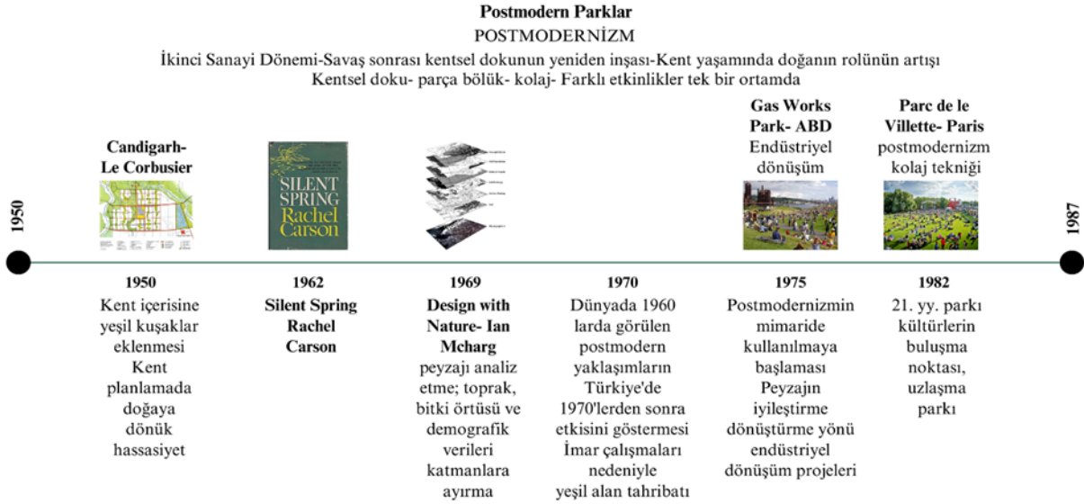
Şekil 2. Postmodern parklar zaman çizelgesi- öne çıkan olay, akım ve park örnekleri (Özdemir Şahin, 2023)

dönem için yeni bir olgu olan halk katılımı sürecini yürütmesi ile de sosyal bakımdan bir prototip olması ile üne kavuşmuştur (Anonim, 2021b). Postmodern dönemin en önemli peyzaj tasarımlarından biri olan Parc de la Villette (1982) ise, eski mezbaha alanında üç ana bölümde olaya dayalı bir kültür bölgesi olarak tasarlanmıştır. Bir peyzaj ya da mimari tasarım örneği olmaktan çok postmodern edebi analizinden türeyen, kültürel ve sembolik referansı çoğulculuk yani kültürlerin buluşma noktası, uzlaşma parkı olan (Tate, 2001) projede postmodernizmin kolaj tekniği ile çalışılmıştır. Şehircilik, haz ve deneycilik projenin anahtar kelimeleridir. Bu; '21. yy. parkı' olmak anlamına gelmektedir (Baljon, 2002).