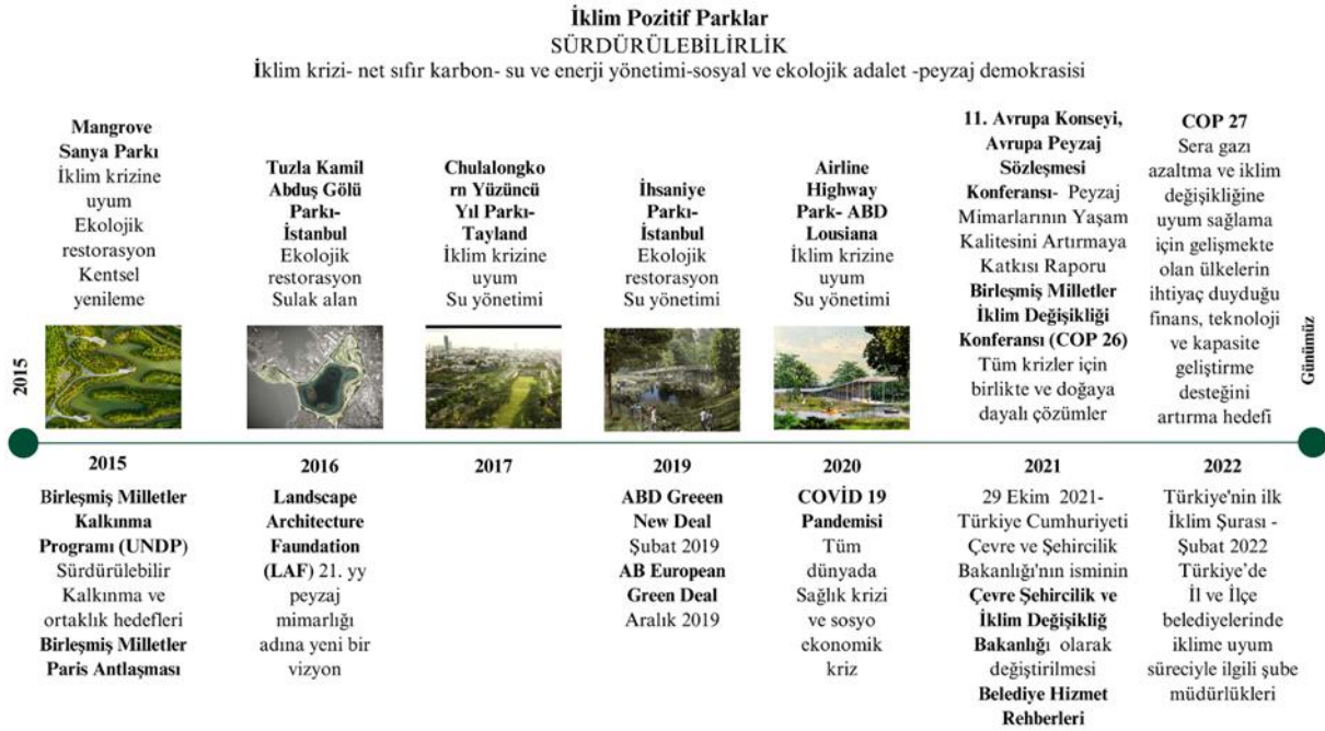
Şekil 5. İklim pozitif parklar zaman çizelgesi- öne çıkan olay, akım ve park örnekleri (Özdemir Şahin, 2023)

Ülkemizde su yönetimi, geri dönüşüm, biyolojik çeşitlilik vb. yaklaşımlarla hazırlanan park örnekleri henüz yaygın olmamakla birlikte 2019 yılında İSKİ bünyesinde yapılan İhsaniye Suyu alanındaki çalışma, tarihi memba alanının ekolojik restorasyonu ile, tampon bitkilendirme, biyolojik hendekler ve yağmur bahçeleri ile çevredeki suların filtrelenmesi, parkın alt kotlarındaki su tutan göletin bir rezervuar ve habitat olarak değerlendirilmesi ve parkın %90’ının geçirimsiz malzeme ve yeşil yüzeylerle kaplı olması ile iklim pozitif bir park olarak (Eşbah Tunçay, 2021) önemli bir örnek teşkil etmektedir. Diğer önemli bir çalışma ise İBB bünyesinde hazırlanan ilk etabının uygulamasına 2020 yılında başlanan İstanbul Tuzla Kamil Abdüş Gölü sulak alan projesidir. Projede su kalitesinin iyileşmesi, gölün ekolojisine katkısı ve Umurdere’nin eski yatağının canlandırılması için bir biyolojik kanal ve yağmur bahçesi tasarımı ile önemli bir iklim pozitif park örneği olmuştur. Park ekolojik sürdürülebilirliğe katkısı yanı sıra, farklı mevsimlerde alanın taşıma kapasitesine göre tasarlanmış rekreasyon programları ile (Anonim 2023k) canlılığı teşvik ederek sosyal sürdürülebilirliği sağlaması ile de dikkate değerdir. Şekil 5’te iklim pozitif parkların zaman çizelgesi sunulmuştur.