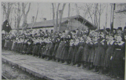
Les enfants des écoles alignés pour saluer le Pacha à son arrivée.

SUR LES QAIS DE LA GARE D'ESKI-CHEIR, EN ATTENDANT MOUSTAPHA KEMAL.