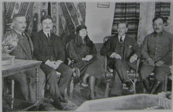
Raouf bey. Latîfe hanoum. Moustapha Kemal. Mahmoud bey.

Un coin du salon de la villa de Moustapha Kemal à Tehankaia.