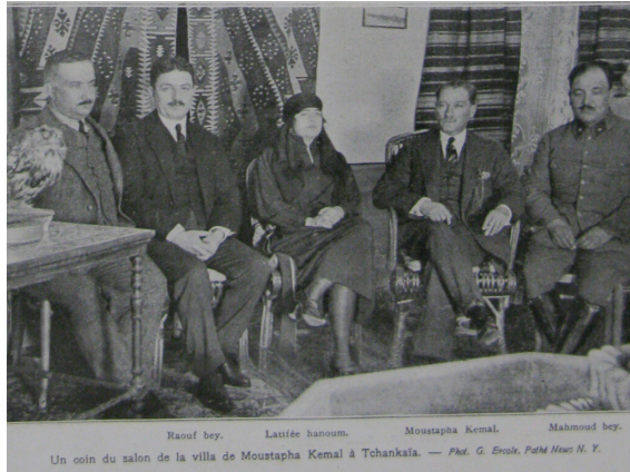
Rauf Bey Latife Hanım Mustafa Kemal Mahmud Bey

Mustafa Kemal’in Çankaya’daki Köşkünün Salonundan bir köşe