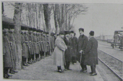
Ismet pacha et les membres de la délégation de Lausanne.

20 février. — A 9 heures du matin, dans le lointain, apparaît, au flanc d'une montagne, la ville d'Angora. Le train entre en gare, au milieu des ovations enthousiastes des troupes et de la population massées. C'est un grand jour. Moustapha Kemal pacha, vêtu d'un long pardessus noir à col de fourrure, coiffé de son « kalpak » si populaire maintenant en Anatolie, est reçu par Kiazim pacha, ministre de la Défense nationale, par Raouf bey, pré-