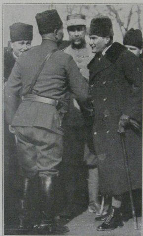
Moustapha Kemal (à droite) reçu, à Angora, par le ministre de la Défense nationale, Kiazim pacha, et par le colonel Mougin, représentant de la République française.

qui attend sous pression et nous emmène vers Eski-Cheir, en longeant la vallée de Kara-Sou. Le spectacle est impressionnant : des centaines de wagons,