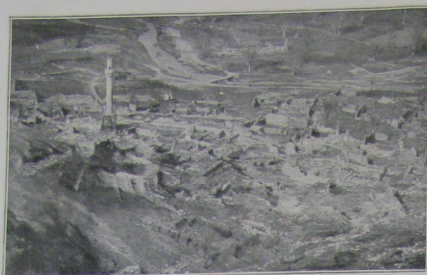
Le village de Yeniköy.