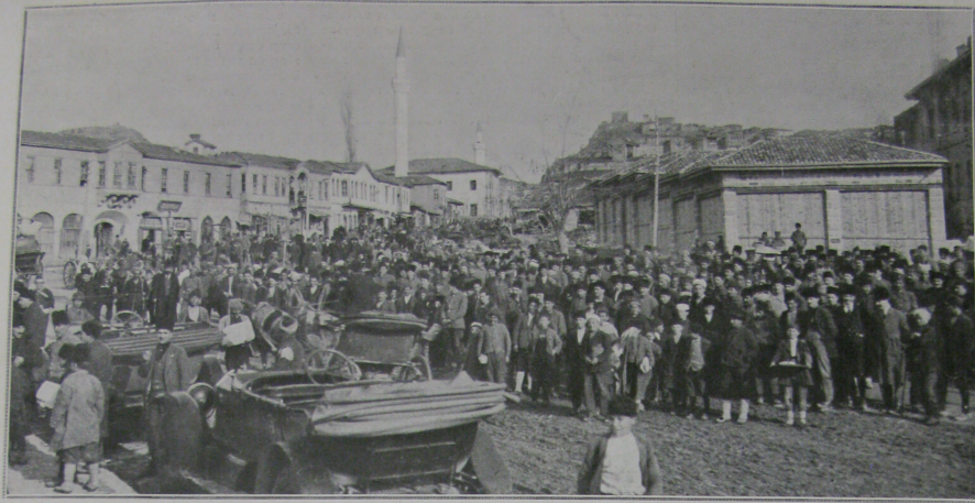
La population d'Angora attendant les résultats de la première séance secrète de l'Assemblée Nationale (21 février).