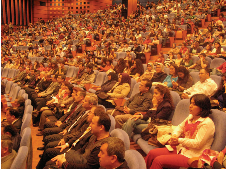
“Mehmet Akif ve Medeniyet” Konferansı