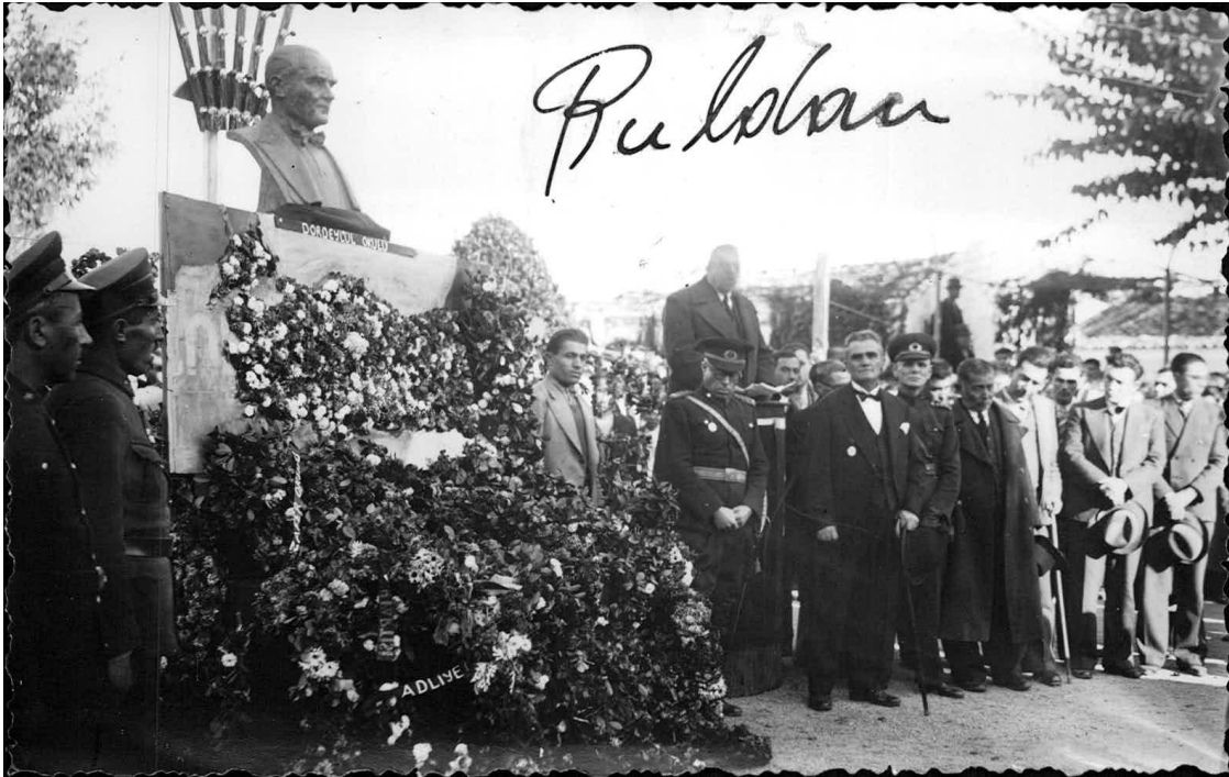
Ek-4: 21 Kasım 1938'de Atatürk'ün cenaze töreni nedeniyle Buldan'da Yapılan törenden bir fotoğraf