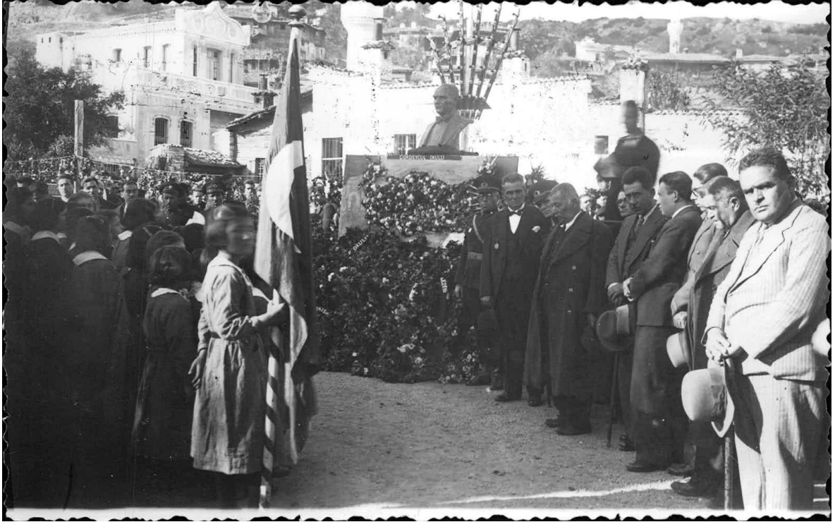
Ek-7: 21 Kasım 1938'de Atatürk'ün cenaze töreni nedeniyle Buldan'da Yapılan törenden bir fotoğraf