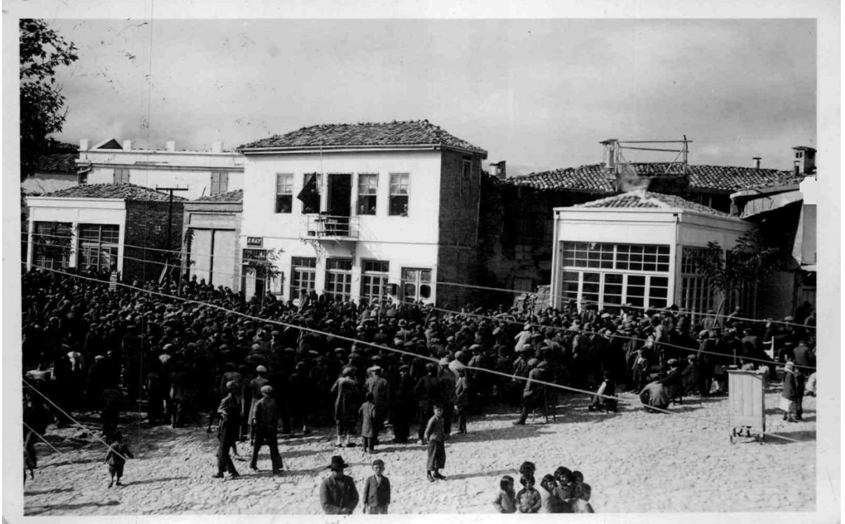
Ek-12: Babadağ'da Belediye önünde toplanan halk Ankara'da yapılan töreni radyodan takip ederken.