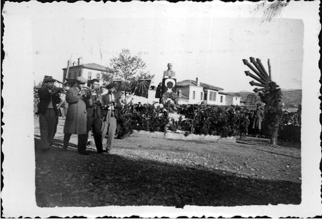
Ek-9: 21 Kasım 1938'de Atatürk'ün cenaze töreni nedeniyle Tavas'ta Yapılan törenden bir fotoğraf.