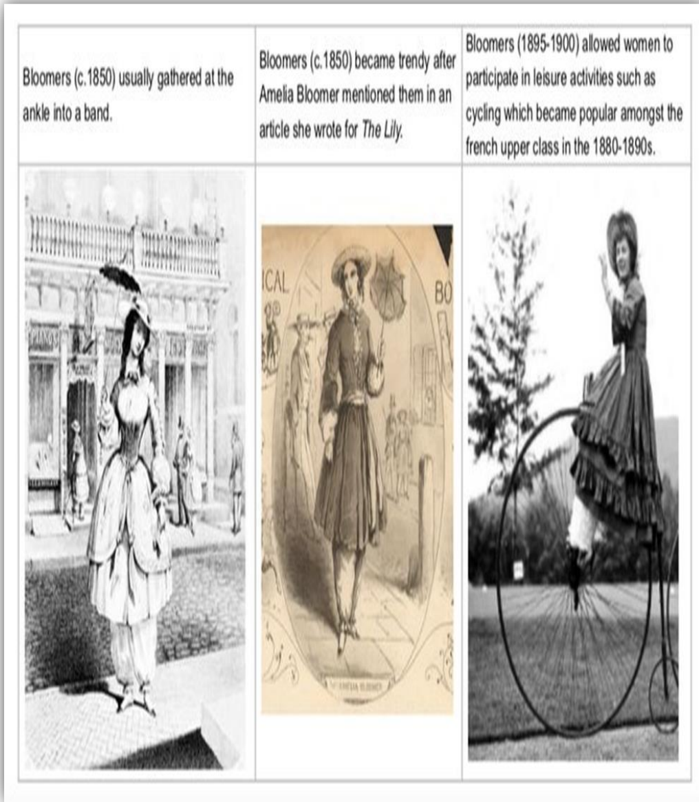
Resim 7: Bloomers, feminist Amelia Bloomer'ın adını almıştır. Bloomers'a ayrıca "türk pantolonu" veya "pantaloons" da denmiştir. https://ch.pinterest.com/pin/637259416016776238/ .