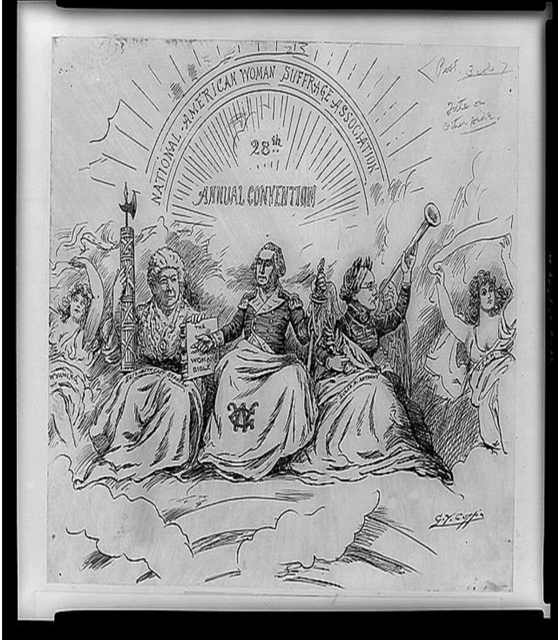
Resim 8: Bu karikatür, Ulusal Amerikan Kadın Oy Hakkı Derneği'nin yıllık kongresini kutlamak için kaleme alınmış. Wyoming ve Utah'ı, George Washington ve iki oy hakkı lideri Susan B. Anthony ve Elizabeth Cady Stanton'ın yanında melek gibi gösteriyor.