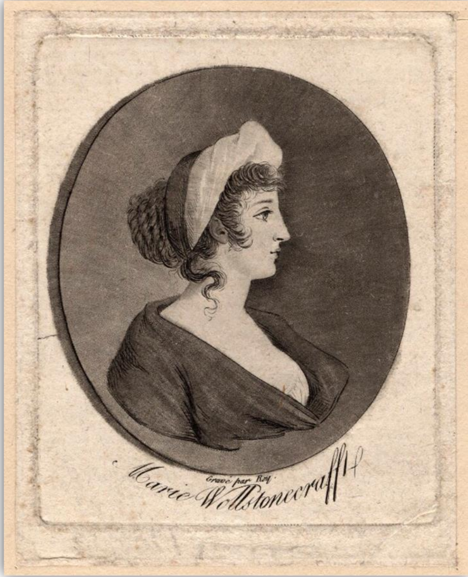
Resim 3: Mary Wollstonecraft, (1759-1797).