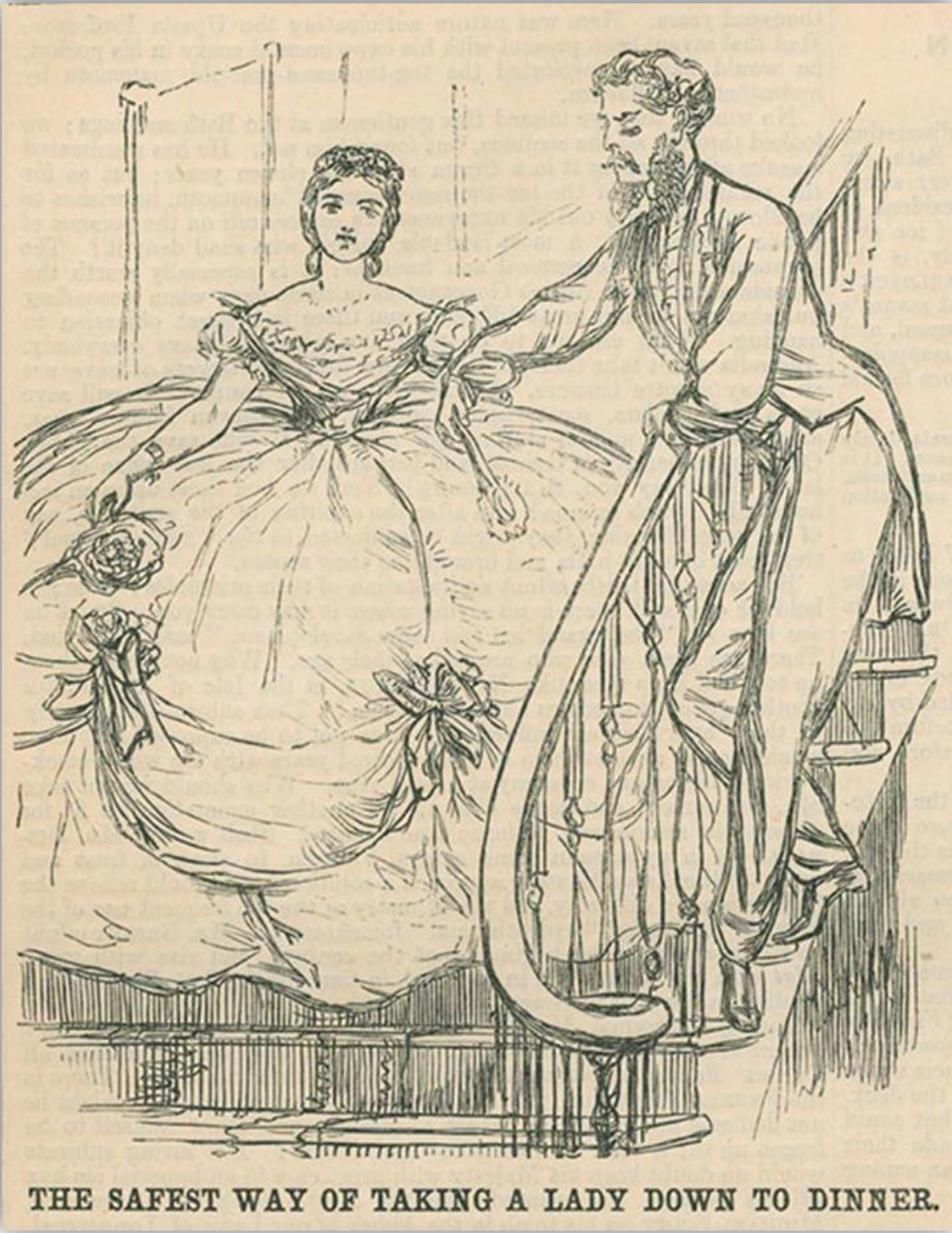
Resim 6: Victoria dönemi kadın giyimi Krinolin. https://mollybrown.org/death-by-crinoline/ .