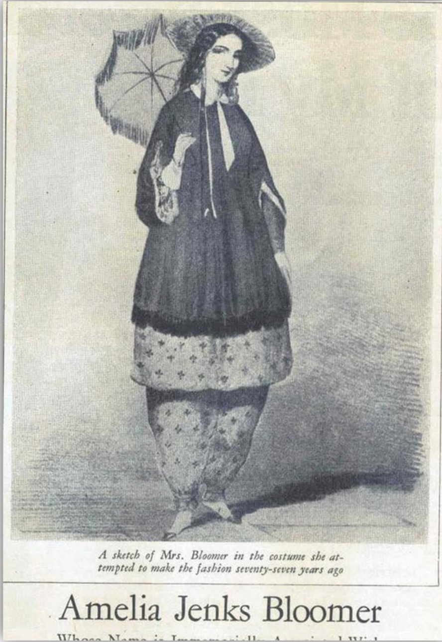
Resim 5: Erişim Tarihi 03.08.2024 saat 18:00

https://pubs.lib.uiowa.edu/palimpsest/article/id/22590/download/pdf/ .