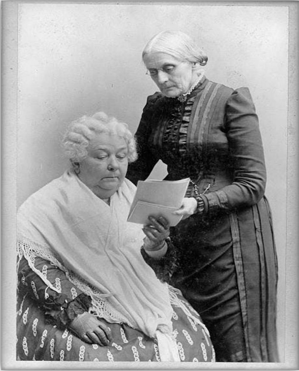
Resim 2: Oturan Elizabeth Cady Stanton ve ayakta duran Susan B. Anthony.