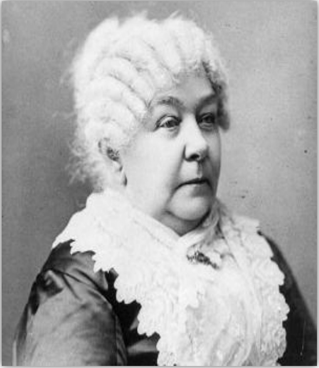
Resim 1: Elizabeth Cady Stanton (1815-1902)