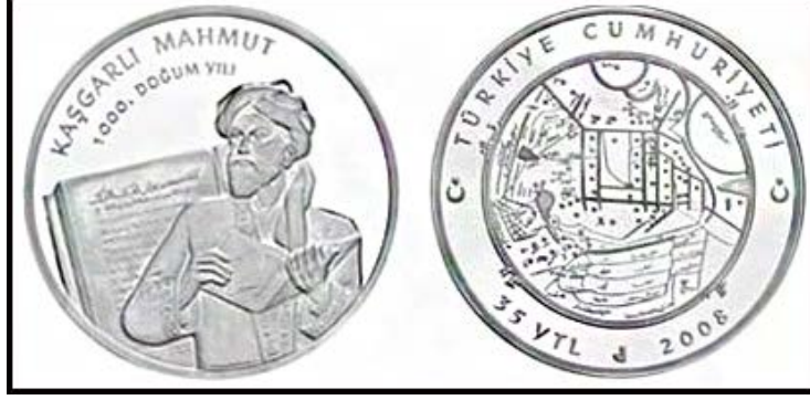
Görsel 6. Kâşgarlı Mahmud hatıra parası, 38,61 mm.