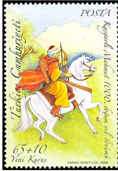
Görsel 2. Kâşgarlı Mahmud 36x52 mm.

Görsel 2’de emisyon programının 7. serisi olarak “Kâşgarlı Mahmud 1000. Doğum Yıl Dönümü” başlığıyla 10.04.2008’de tedavüle çıkarılan ikili serideki anma pullarından bir diğerine yer verilmiştir. Dikey formatta tasarlanan ikinci pulda dantellere kadar baskı uygulandığı görülmekle birlikte sulu boya etkisinin animasyon benzeri bir görünüm oluşturacak yoğunlukta kullanıldığı anlaşılmaktadır. Buna göre tasarımın zemini yukarıya doğru degradeli bir biçimde yeşil renk tonundan mavi renk tonuna dönmekte, orta yaşlarda olduğu görülen Kâşgarlı Mahmud’un ise beyaz bir at üstünde sol elinde bir adet yay ile tasvir edildiği görülmektedir. Yine Kâşgarlı Mahmud’un rüzgârda savrulan pelerini ve atın ön ayakları aceleci tavırları yansıtmaktadır. Ancak Kâşgarlı Mahmud’un seyahat ya da av amacıyla mı ata binip silah kuşandığı tam olarak anlaşılamamaktadır. Buna göre kompozisyonun sağına Kâşgarlı Mahmud 1000. doğum yıl dönümü ibaresi, soluna Türkiye Cumhuriyeti ifadesi, üstüne posta yazısı, altına ise pulun değer ifadesi ile künyesi ilk tasarımdaki gibi serifli yazı fontunda yerleştirilerek kompozisyondaki tipografik kurgu tamamlanmıştır.