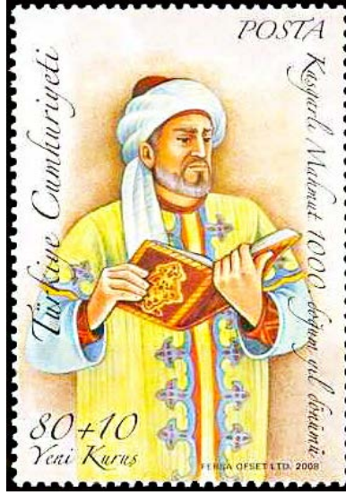
Görsel 1. Kâşgarlı Mahmud Dîvânu Lugâti't-Türk 36x52 mm (Kişisel arşiv).

Kâşgarlı Mahmud'un Dîvânu Lugâti't-Türk isimli eseri 11. yüzyıla ait bir eser olup hem Türk dünyası hem de komşu yerleşimler hakkında bilgiler içermektedir (Ergene, 2023: 172). Dîvânu Lugâti't-Türk sözlük olarak anılıyor olsa da buradaki lügat kelimesi lehçe anlamına gelerek Türk lehçelerini toplayan kitap anlamında kullanılmıştır (Ercilasun ve Akkoyunlu, 2014). Kâşgarlı Mahmud bu eserde tarım, hayvancılık, süsleme sanatları, giyim-kuşam, zanaat, çalgı aletleri, eşya, alet, tedavi biçimleri, atasözü, dörtlük ve beyit gibi olgulara değinerek Türk coğrafyası ve boylarının yanı sıra inanış ve toplumsal yaşamın halk hekimliği, örf ve gelenek konuları hakkında da detaylı bilgilendirmelerde bulunmuştur (Ergönenç, 2024; Karahan, 2022).