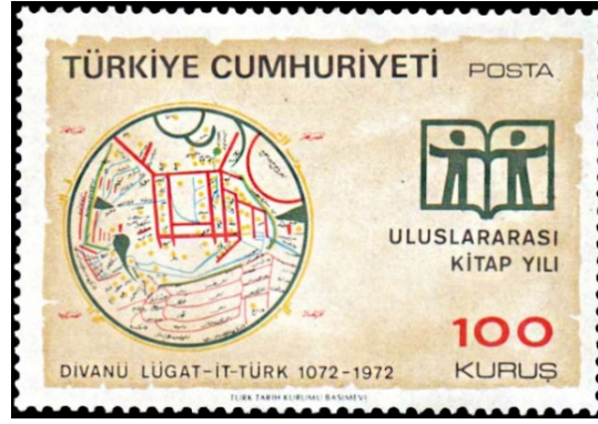
Görsel 4. Uluslararası Kitap Yılı, 52 x 36 mm. (Pulhane, 1972).