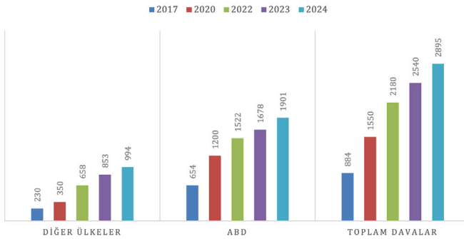
Tablo 2. İklim dava sayılarının dağılımı

İklim değişikliğine ilişkin davaların çeşitliliği her geçen gün artarak farklı coğrafi bölgelerde de davalar açılmaktadır. İklim değişikliği davaları sivil topluma, bireylere ve toplumun her kesimine, hükümetlerin ve özel sektörün iklim krizine karşı aldıkları yetersiz önlemleri tartışmak için olası bir yol sunmaktadır (UNDP ve Columbia Law School Sabin Center For Climate Change Law, 2023).