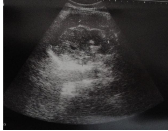
Resim 1: Karın USG; dalak hilusuna komşu, 83x64 mm boyutlarında, içinde milimetrik kalsifikasyonlar içeren, heterojen içerikli kistik kitle görünümü.

oral gıda başlanan olgu 5. günde sorunsuz olarak taburcu edildi.