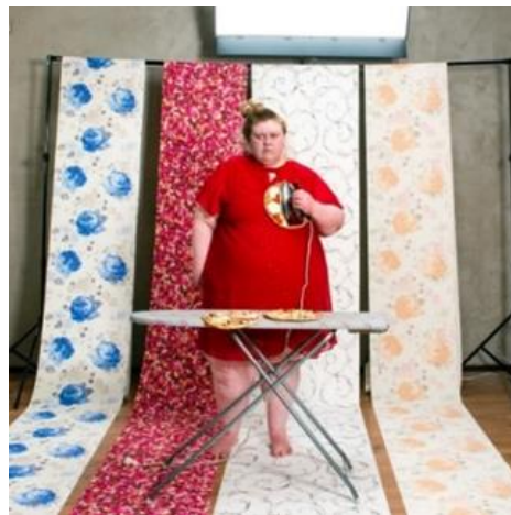
Görsel 6. Iiu Susiraja, Sevgilerle Pizza , 2019, 60x60 cm, Archival Inkjet baskı, akçağağaç çerçeve, optiwhite cam.

Neredeyse her çekilen fotoğraf karesinde yüzü izleyicisine dönük, ciddi ve bazense sinir bozucu bir şekilde duran sanatçının Görsel 6'da görüldüğü gibi pozlara yüklenen karakteristik özellikleri arasında cesur, net ve özgürlükçü bir imaj vardır. İzleyiciyi ifadeyi çözümlenmek ve gerçeğe dayalı amacı eleştirmek adına odaklayan bu duruşlarda Susiraja, tıpkı sanat tarihinin geçmişindeki pek çok sanatçı gibi kendini model olarak kullanmıştır. Ancak Susiraja'nın çalışmalarını geleneksel sanat tarihindeki çalışmalardan ayıran şeyin; kadına yönelik estetik algıyı farklılaştırıp değiştirmesi ve onun orijinal, düzeltilmemiş, estetik olmayan, özgüvenli yere basan duruşu olduğu kabul edilebilir (http 6). Bunlarla beraber Susiraja'nın çalışmalarına yansıyan şeyin; dönemin kadına yönelik toplumsal rolleri, depresif koşulları ve çeşitli sosyolojik problemleri olduğu da gözlemlenebilir. Bu doğrultuda bu pratiklerin, çok kültürlü ve evrensel bir etki alanı yarattığı da söylenebilir.