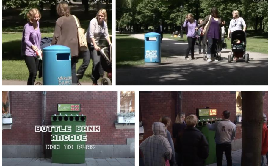
Görsel 12. Volkswagen için tasarlanan "Fun Theory" isimli kampanyanın "Deepest bin" (üst) ve "Bottle Box" uygulaması.

Volkswagen, bu uygulamaları video kayıtları haline getirmiş ve kampanya sloganını "Eğlencenin davranışları daha iyi yönde değiştirebileceği açıktır" (Fun can obviously change behaviour for the better) olarak belirlemiştir. Bu içerikler kendi sosyal medya hesaplarında yayınlanmıştır. Bu kampanya deneysel gerilla reklamlar için çok etkileyici bir örnektir. Kampanyanın sonunda, tüm uygulamaların diğer yerel seçeneklere göre çok daha fazla kullanıldığı sonucu dikkat çekicidir. Bu sayede insanlar hem eğlenmiş, hem de çevre için yararlı bir aktivitede bulunmuşlardır.