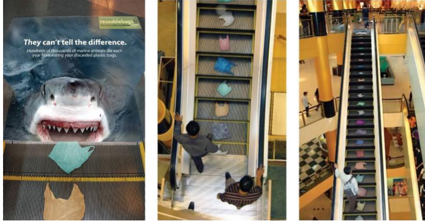
Görsel 7. Reusablebags.com için tasarlanan “They can't tell the difference” isimli kampanya.

Ağzını açmış bekleyen bir köpekbalığı, ürkütücü bir görüntüdür. İzleyici önce bu görüntü ile sarsılmakta; ardından doğada çözünmeyen bir atık türü olan plastik poşetlerin görüntüleri ile köpekbalığının uyumsuz eşlemesi zihninde bir uyarı oluşturmaktadır. Aynı zamanda plastik poşet görüntülerinin yapıştırıldığı basamakların üzerinde ilerliyor olmak da bireysel sorumluluk kavramının altını çizmektedir.