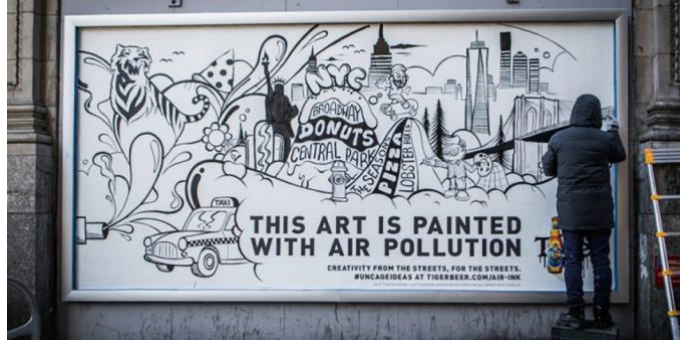
Görsel 10. Heineken Tiger Beer için tasarlanan "Air-Ink" isimli kampanya.

4.9. Heineken/"Air-Ink" Kampanyası: Heineken'in "Tiger Beer" ürünü için Marcel Sydney tarafından tasarlanan Air-Ink kampanyası, mürekkep yerine hava kirliliğini kullanan sokak sanatına yönelik dikkat çekici yaklaşımı nedeniyle Cannes 2017'de Altın Aslan kazanmıştır (Görsel 10).