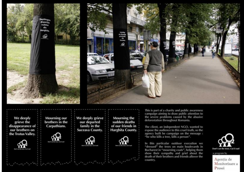
Görsel 5. Grey Worldwide Romanya tarafından tasarlanan “Don’t cut the trees. Cut it out!” isimli kampanya.

Ağaçlara asılan ilanlarda “Trotus Vadisi'ndeki kardeşlerimizin kaybolmasının derin üzüntüsünü yaşıyoruz”, “Karpattlar'daki kardeşlerimizin yasını tutuyoruz”, “Suceava İlçesinde vefat eden ailemizin yasını derinden tutuyoruz” ve “Harghita İlçesindeki dostlarımızın ani ölümlerinin yasını tutuyoruz” cümleleri yer almaktadır. Okuyanın dikkati çekerek, insanlığın en büyük hassasiyetlerinden biri olan ölüm, kayıp duyguları yoluyla empati yapmalarını sağlamak amaçlanmıştır. Bu yönüyle deneysel reklamın iyi bir örneğidir.