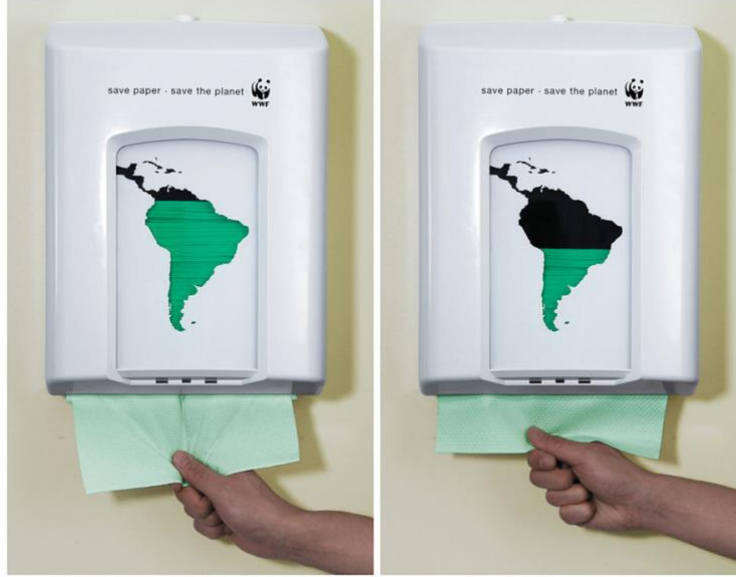
Görsel 2. WWF'nin, Saatchi&Saatchi reklam ajansı tarafından Danimarka'da yapılan "Paper Dispenser" isimli kampanyası, 2007, Danimarka.

Saatchi & Saatchi, kampanyayı "İnsanların gezegeni kurtarmanın kâğıt tasarrufu yapmakla başladığını fark etmelerini sağlamak için standart bir kâğıt dağıtıcısını aldık ve yeşil folyo ve Güney Amerika silueti ile basit bir değişiklik yaptık. Bu sayede ormanın hayatta kalmasının insanların ne tükettiğiyle doğrudan bağlantılı olduğunu kanıtladık" sözleriyle açıklamıştır. "Paper Dispenser" başlıklı bu profesyonel kampanya 17 Ekim 2007 tarihinde yayınlanmıştır. Kampanya aynı anda hem ortam reklamcılığı hem de tabandan pazarlama örneğidir. Alıcılar, ortamın doğal bir parçası olan kâğıt havlu dağıtıcısını kullandıkça, diğer bir deyişle bunu deneyimledikçe, azalan kâğıtlar Güney Amerika'nın yeşil silüetini, kapkara bir boşluğa çevirmektedir. Kullanıcıların, eylemlerinden sorumlu hissetmesini sağlaması, çevreye verilen zarar konusunda herkesin aktif rolü olduğunun altını çizmesi açısından etkileyici bir deneysel reklamcılık örneğidir.