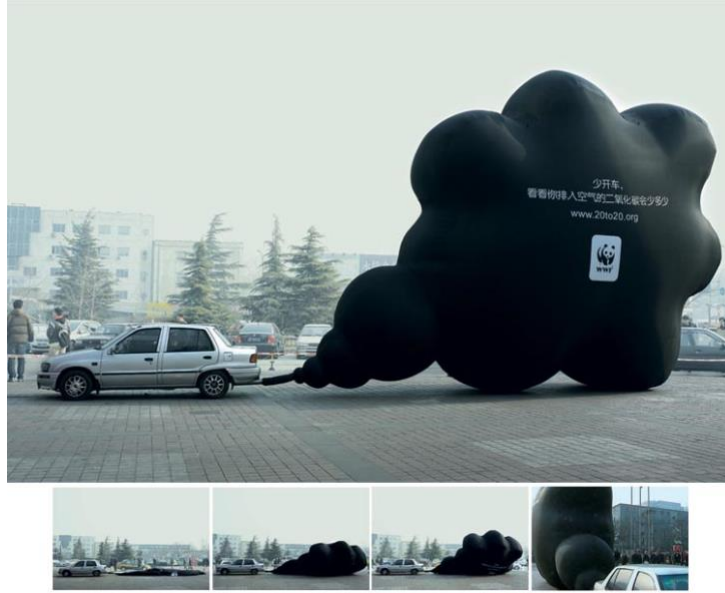
Görsel 1. WWF'nin, Ogilvy reklam ajansı tarafından Çin'de yapılan "Kara bulut" isimli kampanyası, 2007, Çin.

Çin ekonomisi hızla büyürken, şehirlerinin üzerindeki gökyüzü kararmaktadır. Bunun en büyük nedenlerinden biri otomobil sayısındaki ve egzoz emisyonlarındaki olağanüstü artıştır. Ogilvy, "Sürdürülebilir kalkınma için 20 ipucu" kampanyası ile insanları "20to20.org" sitesine yönlendirmek için dramatik bir yöntem belirlemiştir. Kampanya, CCTV 9'un yanı sıra bir dizi Çin gazetesinde ve Pekin TV, Phoenix TV, Almanya'daki Deutsche Welle Broadcasting ve Orta Doğu'daki Al Jazeera gibi uluslararası haber kanallarında da yer almıştır. Görsel uyarılar, yazılı ve sözlü uyarılardan daha akılda kalıcıdır. Bu kampanyada kullanılan büyük, siyah ve plastik balon, doğaya verilen zararı somutlaştırmış olması açısından etkileyicidir.