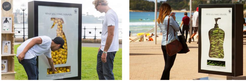
Görsel 4. Leo Burnett tarafından WWF için tasarlanan “Just” isimli kampanya, 2014, Avustralya.

Bir ürünün tercih edilme potansiyelini oluşturan etkenlerden biri de pratikliğidir. Özellikle temizlik ürünlerinde, hijyen sağlama amacının yanında kullanım kolaylığı sunması da önemli bir özelliktir. Bu kampanya, kimyasal temizlik malzemelerinin atık oluşturarak doğaya verdiği zararın altını çizerken, izleyiciye pratik alternatifler sunuyor olması açısından etkili görünmektedir.