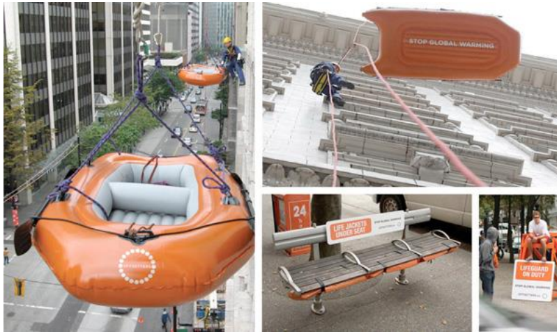
Görsel 8. Rethink tarafından Offsetters için tasarlanan “Stop global warming” isimli kampanya.

4.7. Offsetters/“Stop global warming” Kampanyası: Rethink ajansı tarafından, şirketlerin ve bireylerin karbondioksit emisyonlarını dengelemelerine yardımcı olan Offsetters kuruluşu için tasarlanan “Stop global warming/Küresel ısınmayı durdurun” isimli kampanya Eylül 2008'de Kanada'da yayınlanmıştır (Görsel 8).