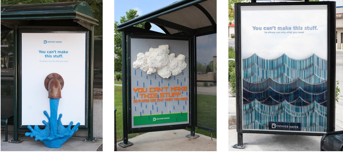
Görsel 6. Sukle Advertising tarafından Denver Water için tasarlanan “Use only what you need” isimli kampanya.

Afişlerin üzerinde “You can’t make this stuff/Bunu yapamazsın” yazmaktadır. Otobüs durağı, kaldırım ya da yol kenarı gibi kamuya açık alanlara yerleştirilen bu çalışmalarda kullanılan malzemelerin hepsi su ile ilgisi olmayan yapay malzemelerdir. Suyun temizlik, saflık, doğallıkla özdeş algılandığı düşünüldüğünde, izleyiciyi bu yapaylıkla rahatsız etmeyi amaçlayan kampanya, Denver kentinde hızla yayılmış ve farklı temalar içeren yeni çalışmalar kentin her yerinde kullanılmıştır. Denver Water aynı zamanda kendi internet sayfasında hem kampanyaları tanıtmakta, hem de sürdürülebilirlik üzerine açıklamalar yaparak, su tasarrufunu teşvik etmektedir.