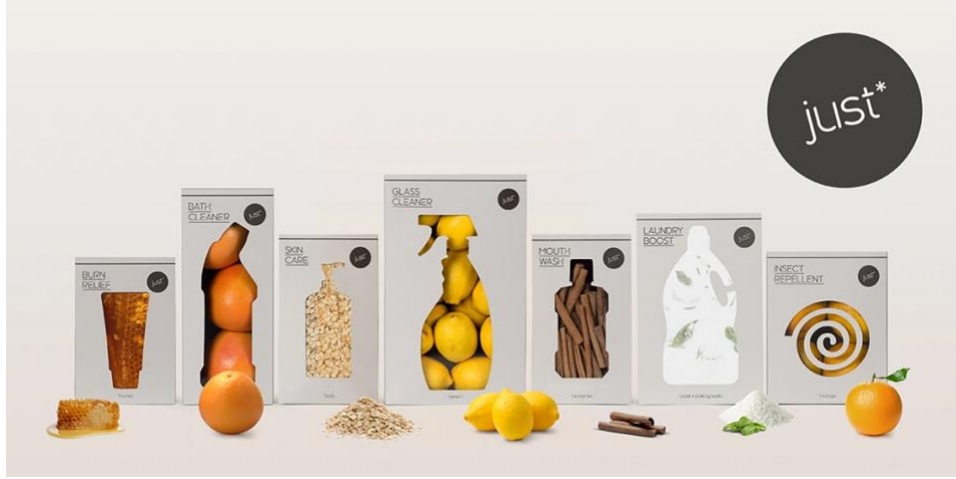
Görsel 3. Leo Burnett tarafından WWF için tasarlanan “Just” isimli kampanya, 2014, Avustralya.

temizlik ve bakım malzemelerinin, ilgili kimyasal ürünün ambalajını çağrıştıracak şekilde ve %100 dönüştürülebilir kartondan ambalajları oluşturulmuştur.