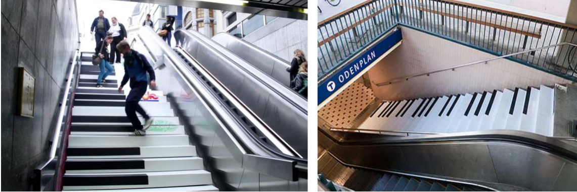
Görsel 11. Volkswagen için tasarlanan “Fun Theory” isimli kampanyanın “Piano stairs” uygulaması.

4.10. Volkswagen/“Fun Theory” Kampanyası: Volkswagen İsviçre için DDB Stockholm tarafından tasarlanan Fun Theory kampanyası birden fazla gerilla çalışmayı hayata geçirmiştir. Volkswagen, performanstan veya sürüş keyfinden ödün vermeden çevresel etkiyi azaltmaya yardımcı olan bir dizi otomobil ve yenilik projesi olan Blue Motion Technologies'e ilgi uyandıracak bir kampanya oluşturulmasını istemiştir. DDB Stockholm'ün çözümü, arabaların arkasındaki düşünceye odaklanan bir teoridir: İnsan davranışını daha iyiye doğru değiştirmenin en kolay yolu, bunu yapmayı eğlenceli hale getirmektir. Buna “Eğlence Teorisi” (Fun theory) adı verilir. Birkaç farklı kamusal alan uygulaması düzenlenir: Bir piyano merdiveni (Görsel 11), 15 metrelik bir çöp kutusu ve şişe kutusu oyunu (Görsel 12).