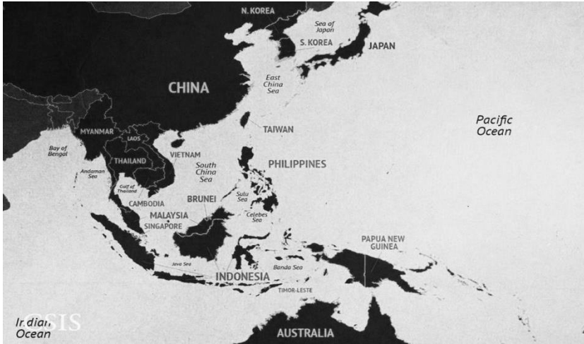
Harita 1: Güney Çin Denizi

Denizde su altında ve üzerinde olmak üzere yüzlerce küçük ada-adacık, kayalık ve resif bulunmaktadır. Bu coğrafi yapılar özelde dört