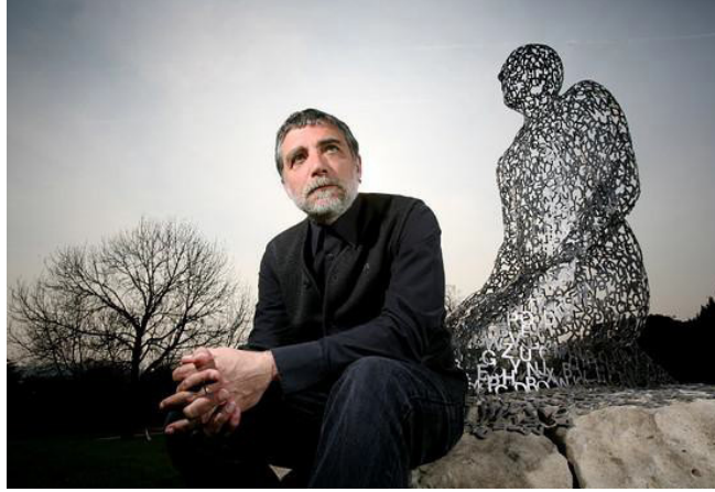
Resim: 2 Jaume Plensa, “Ben, Sen, O” (Plensa, 2006), Yorkshire Heykel Parkı, http://www.bbc.co.uk/news/entertainment-arts-13034363

eser ve söylem arasında birbirinin içine geçmiş ve birbirini sarmalayan şiirsel bir bağ vardır. Sanatçı özellikle yakın geçmişteki eserlerinde insan vücutlarına, kişisel portrelere ve geometrik şekillere daha fazla yer vermesine rağmen bahsi geçen tüm eserlerinde dilin dolaylı ve açık bir şekilde izleri gözlemlenmektedir.