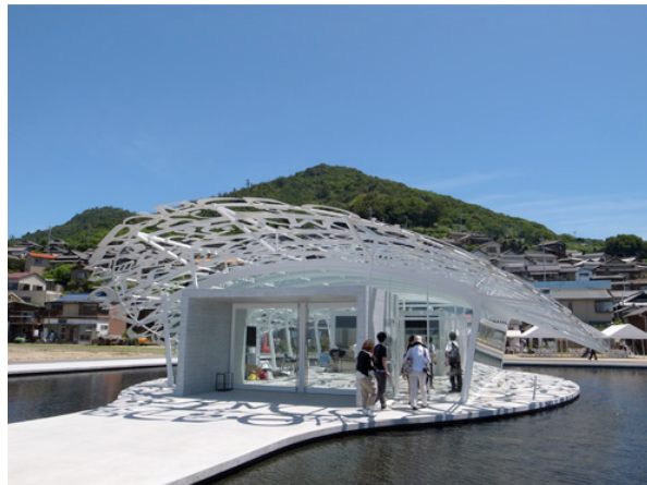
Resim :3 Jaume Plensa, Ogijima'nın Ruhu (Plensa, 2009), Japonya, http://ism.excite.co.jp/art/rid_Original_18918/ .

Plensa'nın edebiyata olan düşkünlüğü çocukluğunun kitaplarla dolup taşan bir evde geçmesi ile açıklanabilir, yıllar sonra eserlerine taşıyacağı harfleri, kelimeleri, metinleri hep çocukluk döneminde keşfetmiştir. Sanatçı kendisiyle yapılan bir röportajında yapıtlarıyla olan ilişkisini “ Resim yazıya daha yakın dursa da heykel benim için şiire daha yakın. ” şeklinde aktarmaktadır (İğrek, 2011).