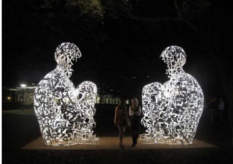
Resim: 4 Jaume Plensa, House of Knowledge ( Plensa, 2008), Yorkshire Heykel Parkı, http://archivo.eluniversal.com.mx/notas/932934.html

Plensa'nın kamusal alandaki dev heykel yerleřtirmelerinin bir başka örneđi de İngiltere Yorkshire'daki Orijinal ismi 'House of Knowledge' olan 2008 tarihli 'Bilgi Evi' adlı çalışmasıdır (Resim 4). İlk etapta sanatçının bu çarpıcı eserine dışarıdan bakıldığında genel formu itibariyle eserin ana hatları geometrik şekilleri hatırlatan harflerden oluşan insan bedenlerinin gözleri kapalı bir şekilde, iç dünyalarına çekilmiş halde, meditasyon yaptığını anımsattığı düşünülebilir; ancak bu içe dönüş aynı zamanda, harfler ve dil aracılığıyla izleyici ile temas sağlamakta ve bu sayede bakan ile bakılan arasından daha derin bir bağ oluşmasına vesile olmaktadır.