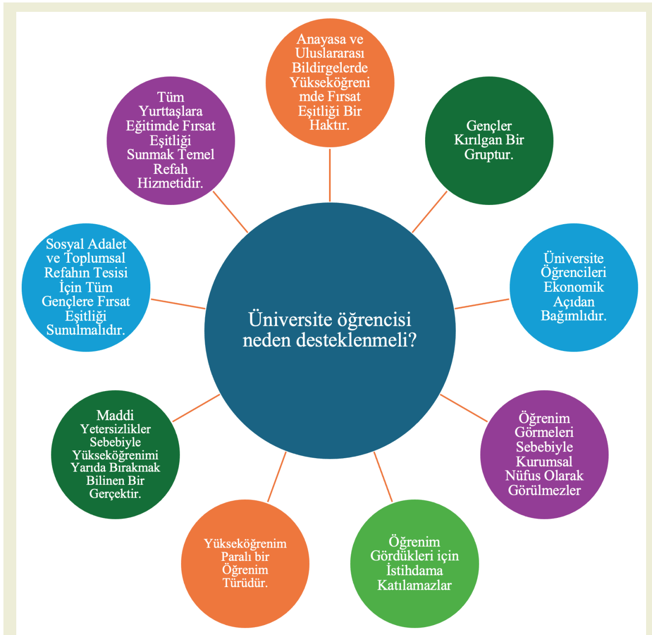
Şekil 2. Üniversite Öğrencisi Gençler Neden Sosyal Politikalar ile Desteklenmeli?

bağımsızlığını alarak ayrı bir eve geçmek olarak verilir. Sosyoloji temelli söz konusu dönemsel tasnife göre maddi anlamda bağımlı oldukları, öğrenimde olduklarından dolayı istihdama katılmadıkları için de ücret gelirinden mahrum olan üniversite öğrencisi gençler sosyal politikanın konusudur. Yine bu kimselerin ülkenin ve toplumun geleceğini meydana getirme potansiyeli sebebiyle refahlarının özellikle korunarak geliştirilmesi gerekliliğini zorunlu kılmaktadır. Birleşmiş Milletlerde (BM) çalışmamızda vurgulanan hususa dikkat çekmektedir. İnsani Gelişim Raporunda gençlerin neden kırılğan ve hatta dezavantajlı bir grup olduğu onların yüksek işsiz-