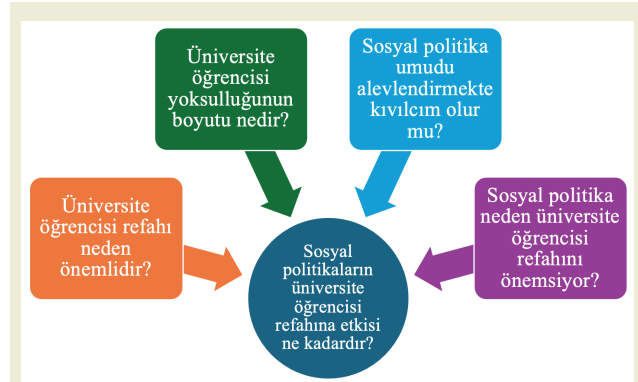
Şekil 1. Problem Tasarımı

miktarlarının satın alma gücü paritesinin sürekli düşmesi, kredi uygulamasının yaygınlaşması, sosyal politikalarda ciddi hedefleme sorunları daha fazla yol kat edilmesi gereken eksiklikler olarak verilebilir. “ Üniversite öğrencisi dostu ” bir refah rejimi olarak tasnif edilen Türkiye’de yarınların umudu gençlere sunacağımız refah ne denli yüksek olursa ülkenin istikbalinin o derece parlak olacağı su götürmez bir gerçektir. Tam da bu noktada çalışmanın temel problem ifadesi üniversite öğrencisi gençlerin refahının toplumsal refah açısından önemi ve sosyal politikaların öğrenci refahına etkisinin ölçülmesi olarak verilebilir.