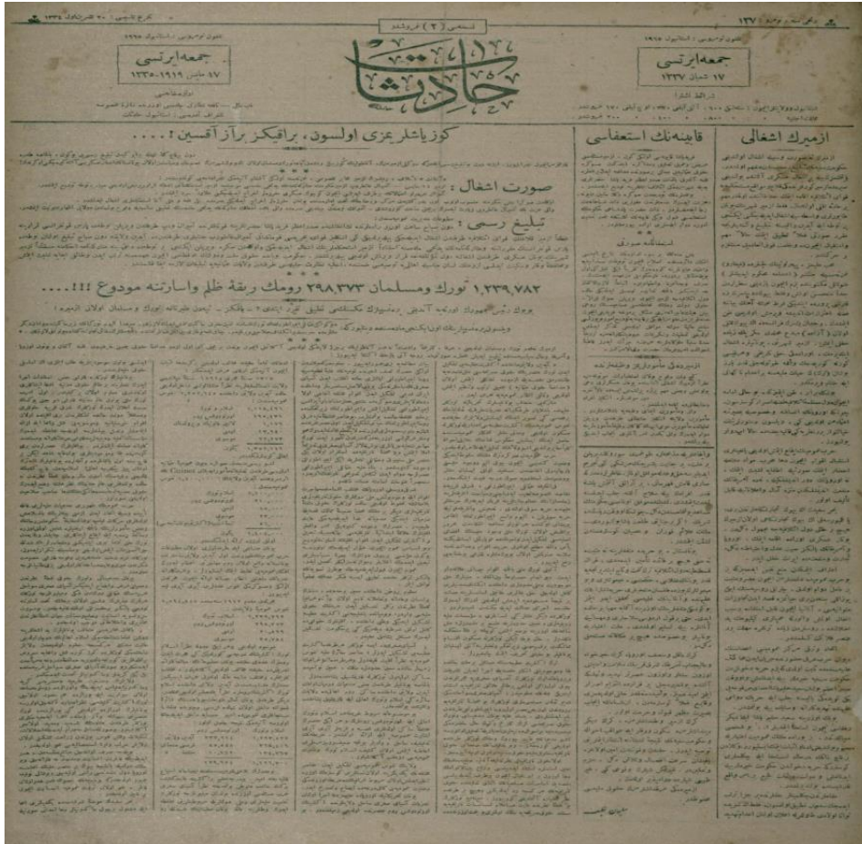
Hadisat, 17 Mayıs 1919 / Hükümetin yayımladığı resmî tebliğ

Söz konusu tebliğ Sabah gazetesi (Sabah Gazetesi, 15 Şaban 1337/16 Mayıs 1919, S: 10597, s. 1) ve İleri gazetesinin (İleri Gazetesi, 15 Şaban 1337/16 Mayıs 1919, S: 7999, s. 1) aynı günkü sayılarında ve Hadisat gazetesinin 17 Mayıs tarihli (Hadisat gazetesi, 16 Şaban 1337/17 Mayıs 1919, S: 137, s. 1) sayısında da yer almaktadır.