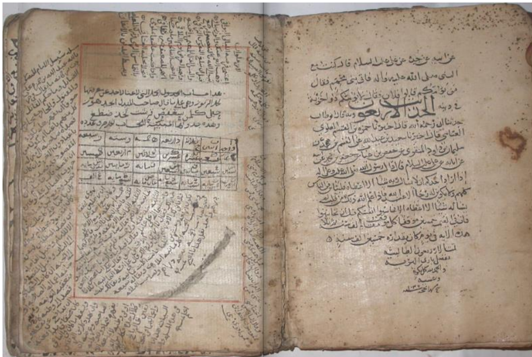
Eserin ilk iki varacağı ve son varacağının fotoğrafları bu şekildedir.