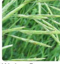
Kılçıksız Brom Bromus inermis