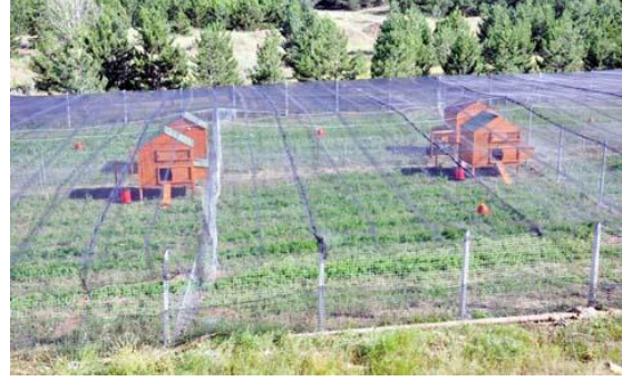
Şekil 2. Sivas organik araştırma sahası

Yapılan bu çalışmalar doğrultusunda; otlak sahasının homojen olarak kullanımını sağlamak amacıyla Cumhuriyet Üniversitesi'nde yapılan bir çalışmada, altı gölgelik olarak tasarlanmış taşınabilir kümesler kullanılmış, yaban kuşları ile teması önlemek, otlak sahasında yarı gölge oluşturmak amacıyla otlak üzeri plastik ağ ile kaplanmıştır. Araştırma sahasının etrafı yırtıcı hayvanlara karşı tel örgü ile korunmuştur (Şekil 1).