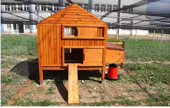
Şekil 3. Organik tavukçuluk için uygun korunaklı barınak