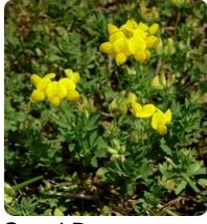
Gazal Boynuzu Lotus corniculatus