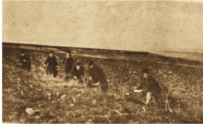
Resim 2. Halkalı Ziraat Mektebi Talebeleri Tarladaki Farelere Zehirli Mısır Serperken

Ülkenin birçok yerinde yaşanan tarla faresi sorunuyla baş edebilmek ve ithalatı durdurmak için Halkalı Ziraat Mektebi'nde tarla farelerini itlaf edebilecek virüs çalışmasına başlanmıştır. 109 1930'ların başlarında Pendik Bakteriyolojihanesi'nde Danysz'nin basiline benzeyen bir bakteri izole edilmiş ve bir süre tarla faresi itlafında yerli üretim olarak kullanılmıştır. 110 İlk etapta da 893 doz üretim yapılmıştır. 111 Ancak başta olumlu sonuçlar elde edilse de yapılan ileri tetkiklerde sıcak havada bozulduğu ve zehri tüketen farelerde aşı etkisi yaptığı anlaşılmıştır. Ayrıca bu karışımı hazırlayarak arazilere serpen kimselerde olumsuz etkiler görülmesinden dolayı kullanımından vazgeçilmiştir. 112