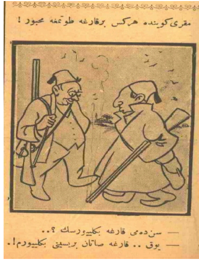
Resim 3. Makri Köyünde Herkes Bir Karga Tutmaya Mecbur!

Osmanlı ve Cumhuriyet Dönemlerinde yetkililer tarıma zarar veren hayvanlarla mücadele için her sene var gücüyle çalışmıştır. İstilaların yaşandığı bölgelerde 18 yaşından büyük herkesin mücadeleye katılımı zorunlu tutulmuştur. İtlaf edilen hayvan karşılığında avcılara bir miktar ödeme yapılması itlafi kazanç kapısı haline getirenlerin türemesi sonucunu doğurmuştur. 1900'lerin başında öldürülen her karga başına 10 ya da 20 para ödenerek avcılar bu uğraşa teşvik edilmiştir. 128 Avcıların ücretleri 15 günde bir Ziraat Bankası'nın şube ve sandıklarından ödenmiştir. 129 1916 yılında avlanılan bir anne kargaya 1 kuruş, yavru kargaya 20 ve karga yumurtalarının her birine de binde 10 para verilmiştir. 130