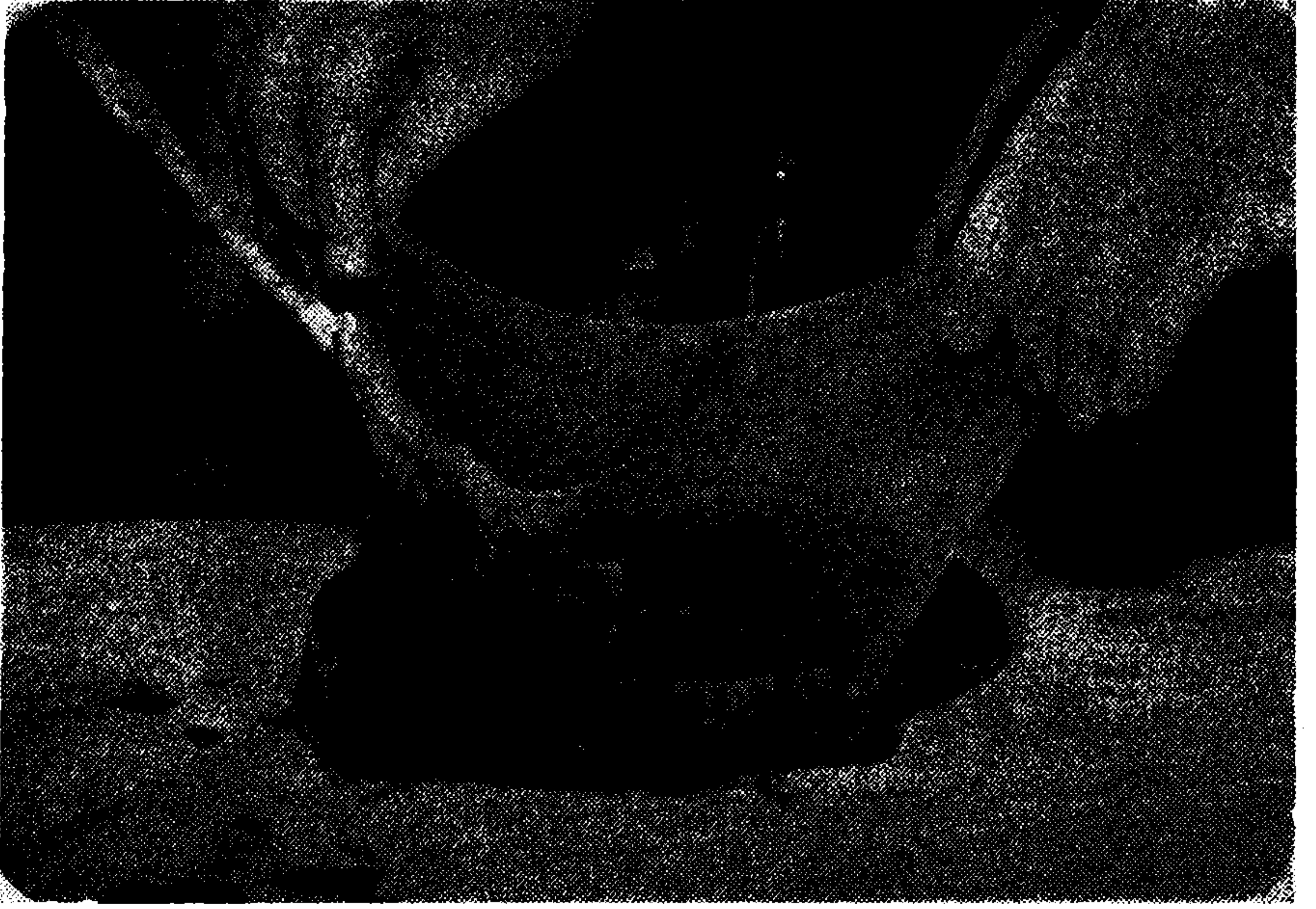
Resim 3. Bebeklerin plasentalarının görünümü.