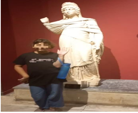
Görsel 5. Isınma Aşaması ikinci kısım