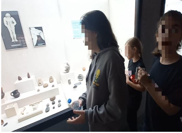
Görsel 1. Müze içi öğrenci bilgilendirilmesi

tarihine önemli katkılarını fark eder” kazanımı ile müzede ilgili uygarlıklara ait kalıntıları somut olarak görüp konu ile bağdaştırdıkları ve merak ettikleri konuları sorup öğrenmeye çalıştıkları gözlemlenmiştir. Bu durum müze gezisinin öğrencilerde kazanım çerçevesinde bilgi almada bizzat konular ile alakalı nesnelere görmenin konuları somutlaştırma açısından yararlı olduğu ve uygulanan etkinliklerde ise istekli oldukları uygulama boyunca keyifle vakit geçirdikleri sonucuna ulaşılmıştır.