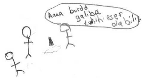
Görsel 4. Isınma Aşaması Öğrenci Çizimi