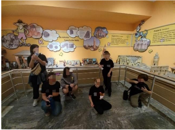
Görsel 3. Isınma Aşaması

Öğrencilerin hazırlamış oldukları resimlerin analizlerinden hareketle öğrencilerin uygulama esnasındaki etkinliklerden yola çıkarak fikir yürüttükleri belirlenmiştir ve bu durumun öğrencilerin etkinlikleri dikkatle izledikleri ve etkinliklerin kalıcılık yarattığı sonucunu ortaya çıkartılmıştır.