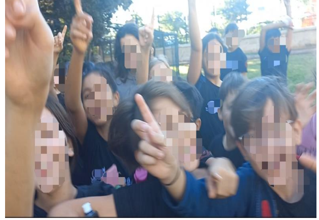
Görsel 2. Uygulama esnası öğrenci katılımı

Öğrencilerin hazırlamış oldukları resimlerin analizlerinden hareketle öğrencilerin uygulama esnasındaki etkinliklerden yola çıkarak fikir yürüttükleri belirlenmiştir ve bu durumun öğrencilerin etkinlikleri dikkatle izledikleri ve etkinliklerin kalıcılık yarattığı sonucunu ortaya çıkartılmıştır.