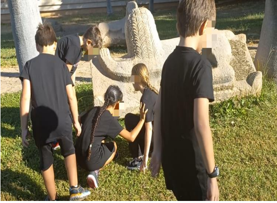
Görsel 7. Canlandırma Aşaması