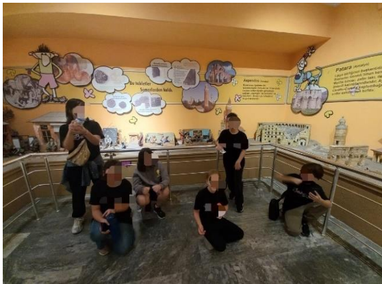
Görsel 3. Isınma Aşaması

Öğrencilerin hazırlamış oldukları resimlerin analizlerinden hareketle öğrencilerin uygulama esnasındaki etkinliklerden yola çıkarak fikir yürüttükleri belirlenmiştir ve bu durumun öğrencilerin etkinlikleri dikkatle izledikleri ve etkinliklerin kalıcılık yarattığı sonucunu ortaya çıkartılmıştır.