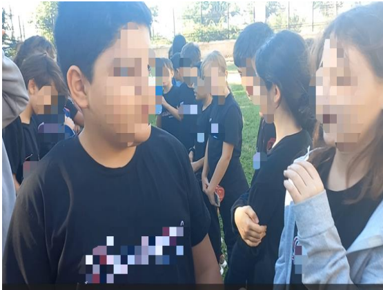
Görsel 7. Değerlendirme Aşaması