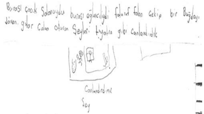
Görsel 8. Canlandırma Aşaması Öğrenci Çizimi