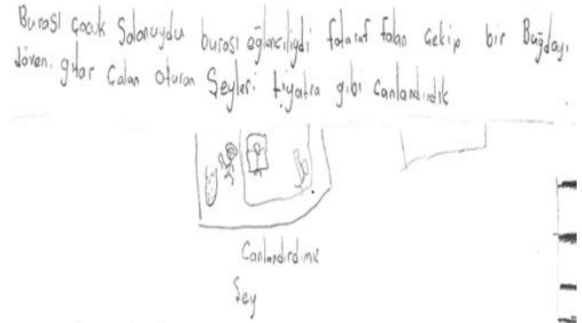
Görsel 8. Canlandırma Aşaması Öğrenci Çizimi