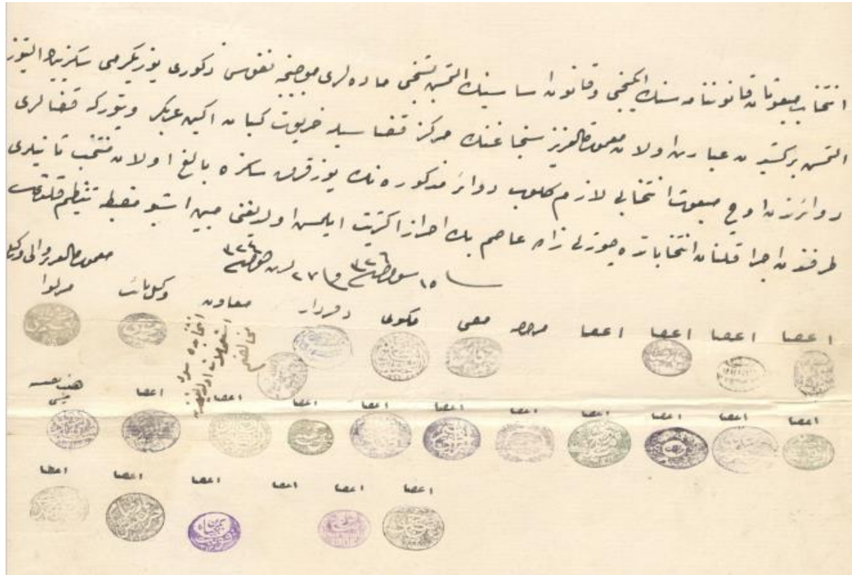
EK 1. Çötelizade Asım Bey'in Mazbatası (1908 Yılı)