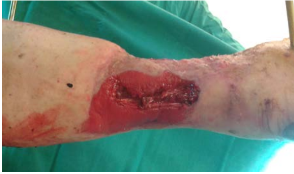
Şekil 1. Pre-operatif görünüm