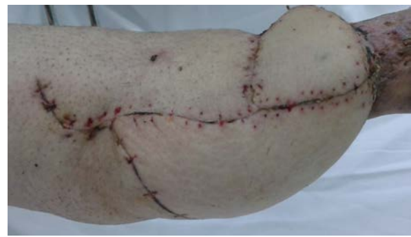
Şekil 6. Post-operatif ilk ay görüntüsü