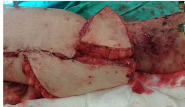
Şekil 5. Per-operatif görüntü