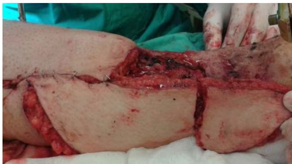
Şekil 4. Per-operatif görüntü