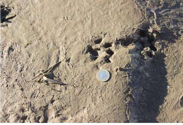
Şekil 3: Su samuru ayak izi İki Köprü mevki, Batman