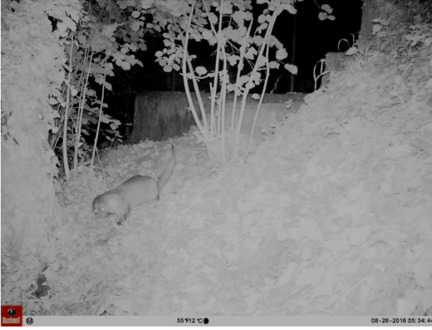
Şekil 4: Avrasya su samuruna ait fotokapan görüntüsü (Saklıkent, Düzce)