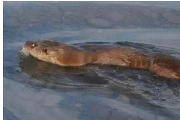
Şekil 2: Sağlık kontrolleri sonrası doğaya bırakılan Lutra lutra , Batman Çayı - Merkez

Düzce ilinde Orman Su İşleri Bakanlığının Tür İzleme Projesi kapsamında yapılan arazi çalışmaları ile Saklıkent, Yığılca, Çilimli ve Cumayeri ilçelerinde yapılan doğrudan ve dolaylı gözlemler ile türe ait dışkı, ayak izi ve muhtemel yuva alanları bulunurken bu alanlarda bırakılan fotokapanlar ile su samuru görüntülenmiştir (Şekil 4).