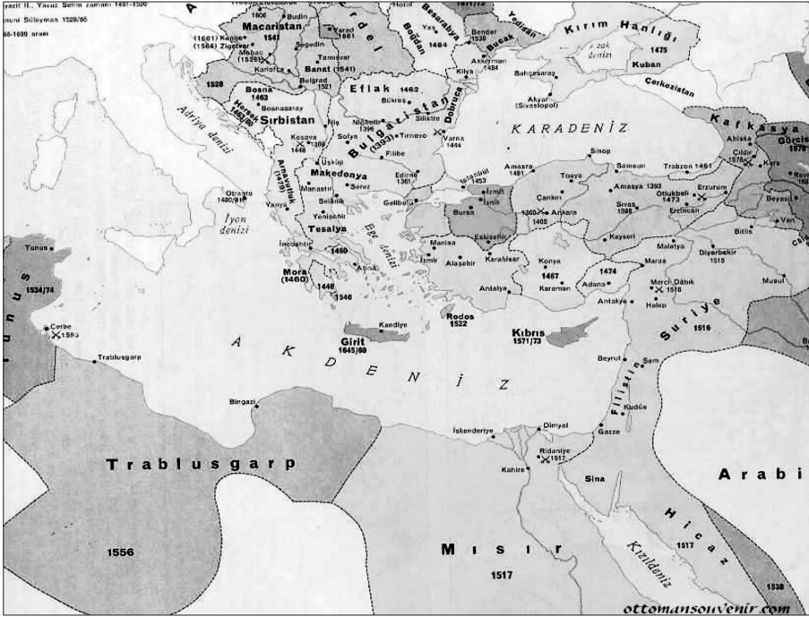
Harita 3: Osmanlı İmparatorluğu Haritası 29