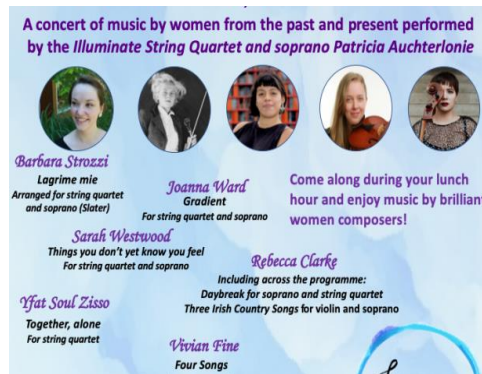
Şekil 5. Rebecca Clarke Three Irish Songs for violin and soprano

( https://twitter.com/MusicPenrith/status/1625071240200290307/photo/1 ) Erişim tarihi: 08.05.2023