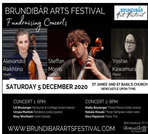
Şekil 8. Lili Boulanger Deux morceaux; Nocturne-Cortège ( https://jamesbasilfenham.org.uk/38106/brundibar-arts-festival-sunday-22nd-nov-2020/ ) Erişim Tarihi: 08.05.2023