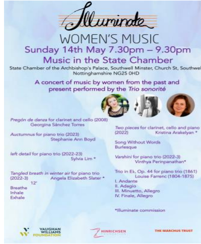
Şekil 3. Louise Farrenc Trio for Clarinet or Violin, Cello and Piano, Op.44

( https://www.classicalevents.co.uk/concerts/state-chamber-archbishops-palace-southwell/14-may-2023/19-30/illuminate-womens-music-with-trio-sonorite-southwell ) Erişim tarihi: 08.05.2023