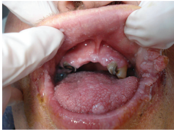
Resim 1. Oral mukozada ve labial kommisürlerde sesil ve vejetatif papüller.

Dermatolojik bakısında bilateral labial kommisürlerde sarı krutların izlendiği birleşmiş verrüköz papüller ve oral mukozada labial ve bukkal alanlarda, dil ucunda ve gingivalarda çok sayıda, yumuşak, verrüköz yüzeyle boyutları 2 ile 14 milimetre arasında değişen kırmızimsı-beyaz ve normal mukoza renginde sesil papüller saptandı (Resim 1). Oral hijyeni bozdu. Bilateral ellerde hem dorsal hem palmar alanlarda ve parmaklarda deri renginde hafif keratozik papüller mevcuttu. Anogenital mukoza olağan görünümdeydi.