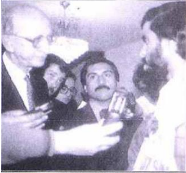
Kağıthane Belediyesi işçileri, İnönü'yü ziyaret ederek bayramını kutladılar. (Fotoğraf: Kenan TÜMER)

Kaynak: Milliyet Gazetesi , 03 Haziran 1993, Milliyet , s.17.