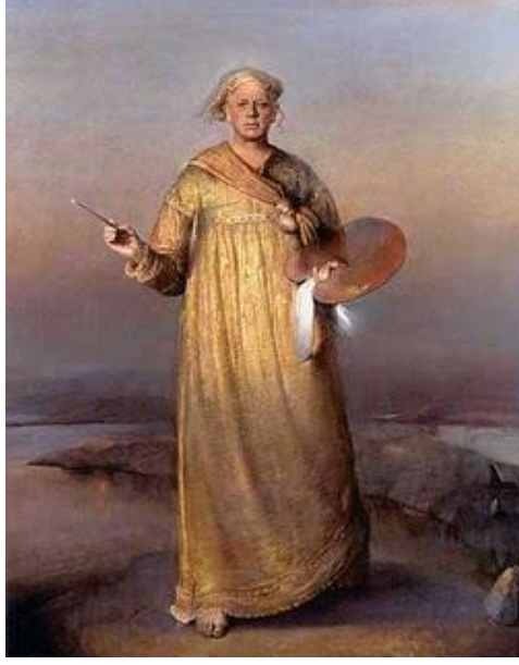
Görsel 2. Odd Nerdrum, İsimsiz 1997, tuval üzerine yağlı boya, 258×202 cm, Özel koleksiyon.

Nerdrum (2010) kitsch üzerine Aforizmalar 'ında insani değerleri ön plâna çıkarır. Nerdrum'a göre insana özgü olan yetenek hayatla bağlantılıdır. Nitekim yetenek deneyimden beslenir ve kendini beceriyle göstermelidir. Bu da çalışmaya, özveriye bağlıdır. Kitsch, metafizik bir olgu değil, melankoli duygusuna ilişkin bir yaratım meselesidir. Görme ve duyumsama kitschte önemlidir. Sanat ise – burada modernist ve avangard anlayıştan bahseder – yeteneğin yalın ifadeciliğini yadsır. Geçmiş hatırlandığı sürece yaratıcı alanlardaki arayış devam eder ve geçmişin tekrarında her daim yeni şeyler keşfetmek ve yeni şeyler ortaya koymak mümkündür. Modern sonrası sanata atıfta bulunan Nerdrum, kitsch'in ciddiyetini sanatın ironisinden çok daha anlamlı bulur. Kitsch tenselliği vurgular. Onda insani duygular duyumsanır ve kitsch, hayattaki sonu olmayan ıstıraba katlanan insanın hayranlık duyduğu melankolik bir yan barındırır. Bu, kendini olduğu gibi göstermekten sakınmayan cesur bir tavra içkin bir melankolidir (Nerdrum, 2010, s. 59).