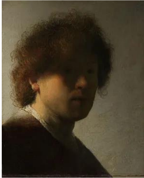
Görsel 6. Rembrandt, Otoportre , 1628, panel üzerine yağlı boya, 24.8 x 31.7 cm., Hollanda.

Velazquez'i hatırlatan bir gerçekçi doğruluk ve yoğunlukla oluştururlar. (Kuspit, 2012b, s. 57)