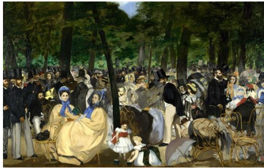
Görsel 4. Édouard Manet, Tuileries Bahçeleri'nde Konser , 1862, tuval üzerine yağlı boya, 76.2 x 118.1 cm.

Seurat, titreşimli duyuların kendi içlerinde ve detayların görsel bir yapıda yapılandırıldığını anlayan ilk sanatçıydı. Gerçekten modern bir sanatçı olmak, bilimsel bir sanatçı olmak, bu yapıları – sanki rengin gizli kodunu – görünür kılmaktı. Kodlanmış duyular matrisi ne kadar görünür hale geldiyse temsil de o kadar, halüsinasyona benzer bir etki yaratır, La Grande Jatte'de olan budur. (aktaran İkizoğlu, 2022, s. 51)