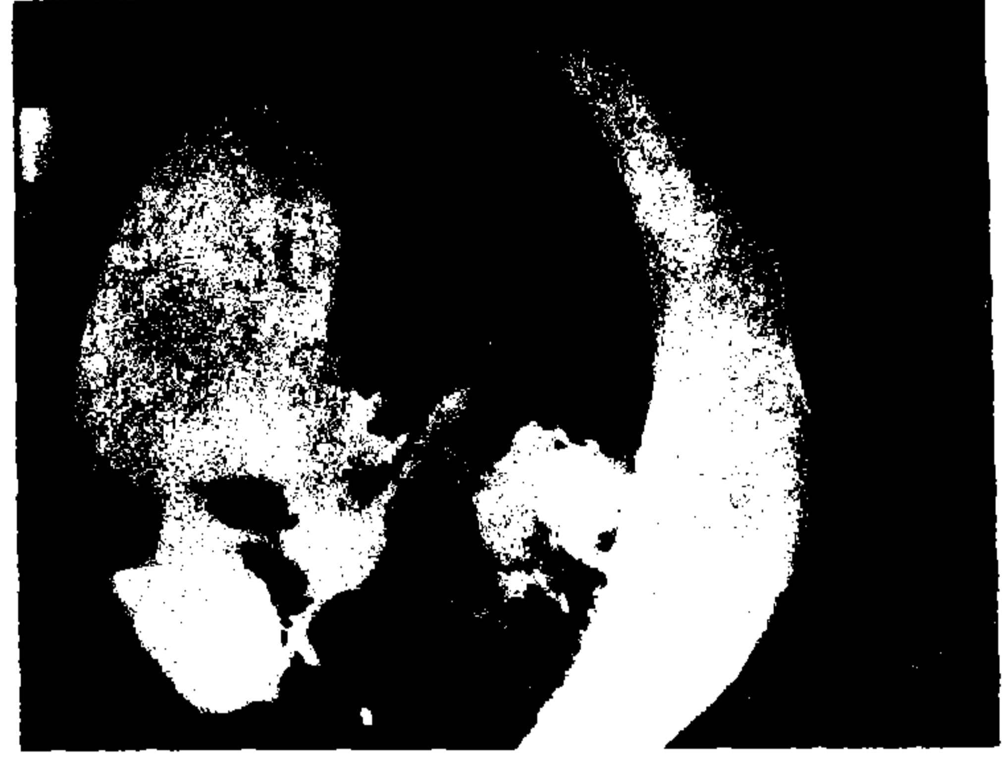
Resim 3,4: Periferik adenokarsinom olgusunda