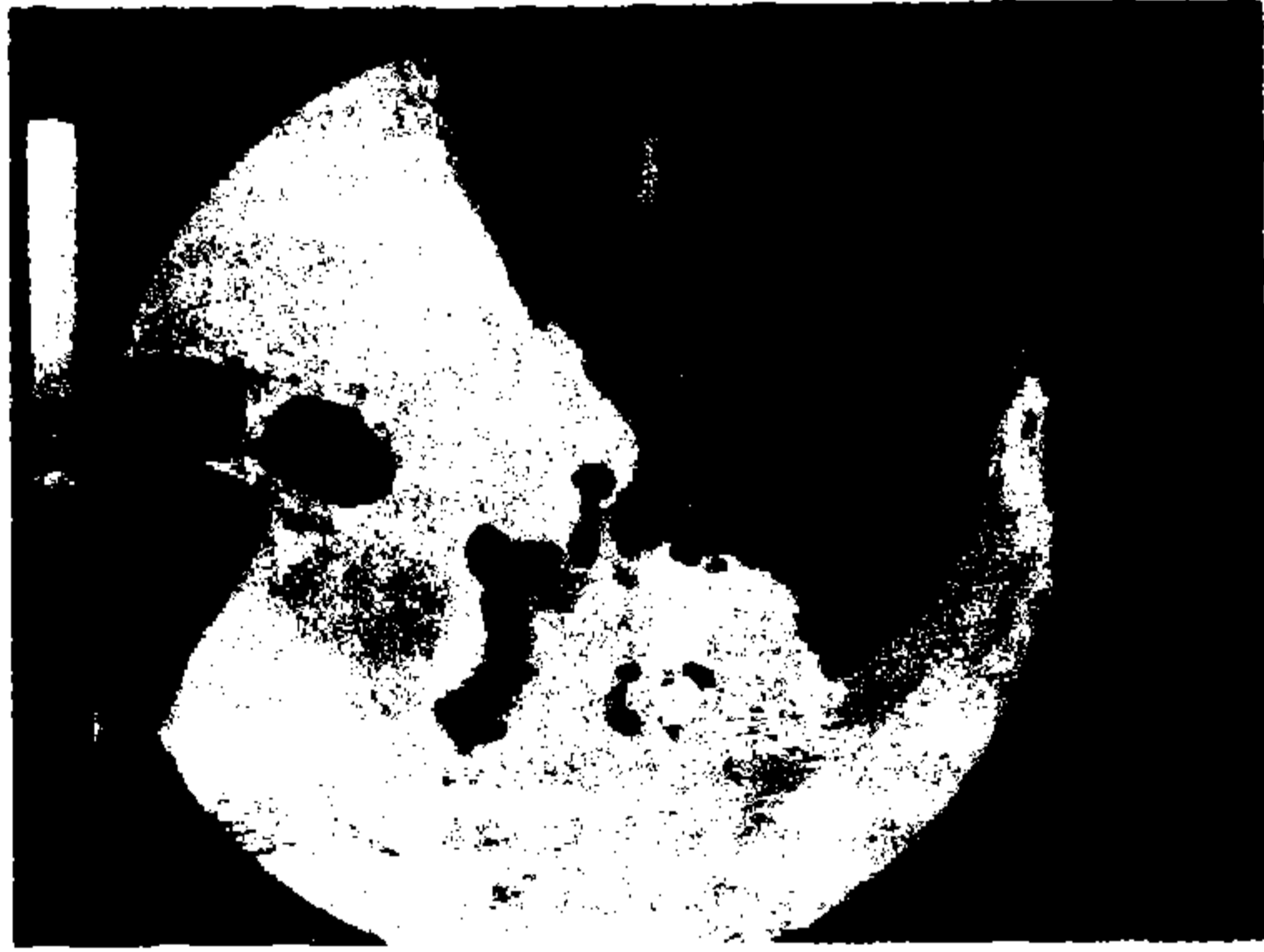
Resim 5: Adenokarsinom olgusunda kitlede hava bronkogramı.