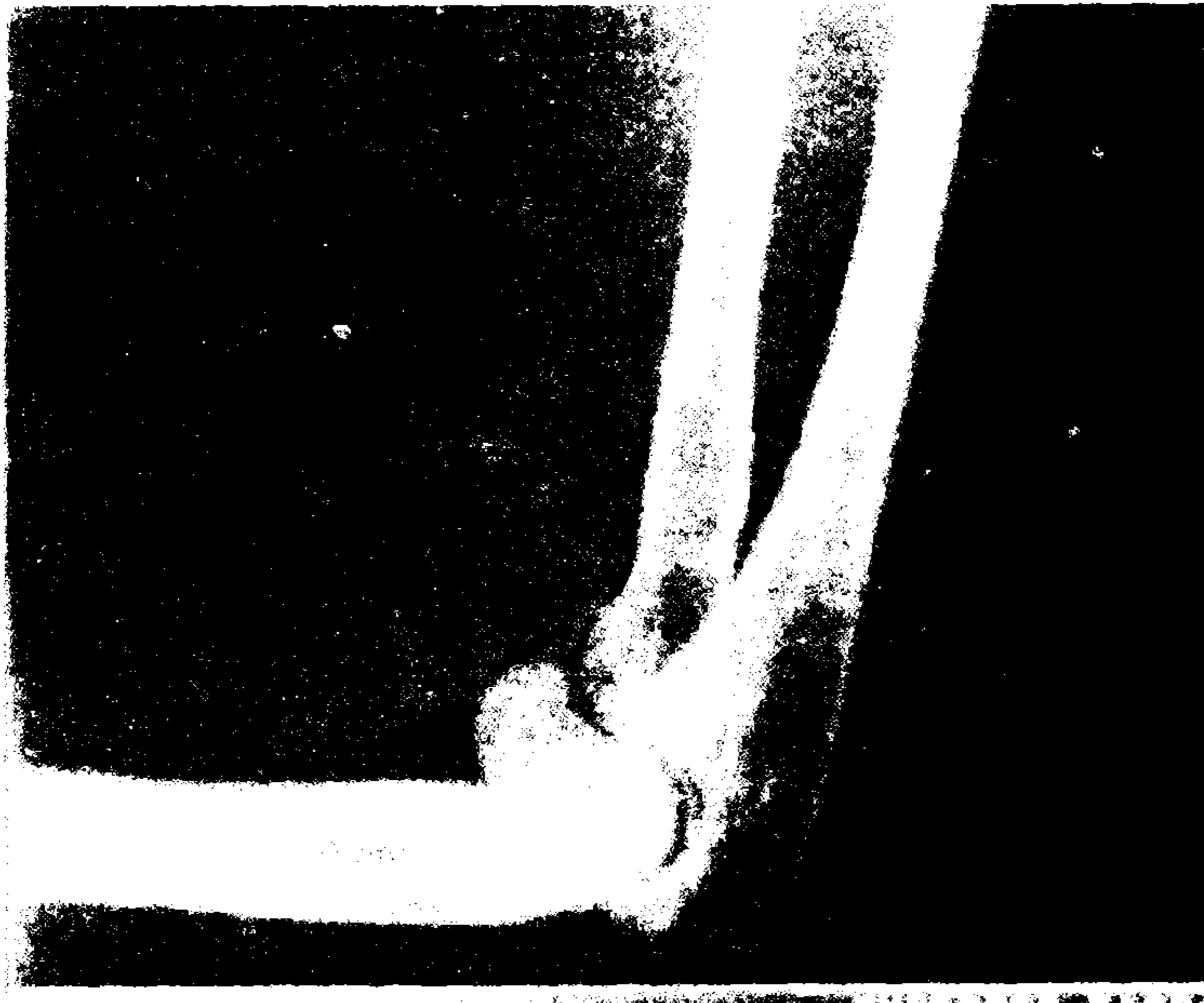
Resim 1-A: 29 yaşında bayan hasta. Radius başı ve kapitellum kırığı

Tedavide sınıflama ve kişisel faktörler baz alınarak erken hareket ve gece atelleme gibi konservatif yöntemler ile açık redüksiyon-Herbert vidası ile internal fiksasyon veya radius başı eksizyonu gibi cerrahi yöntemler kullanıldı. Hasta takiplerinde dirsekten hastanın memnuniyeti, fonksiyonları, radyolojik değerlendirmeleri ve el bileği fonksiyonları araştırıldı.