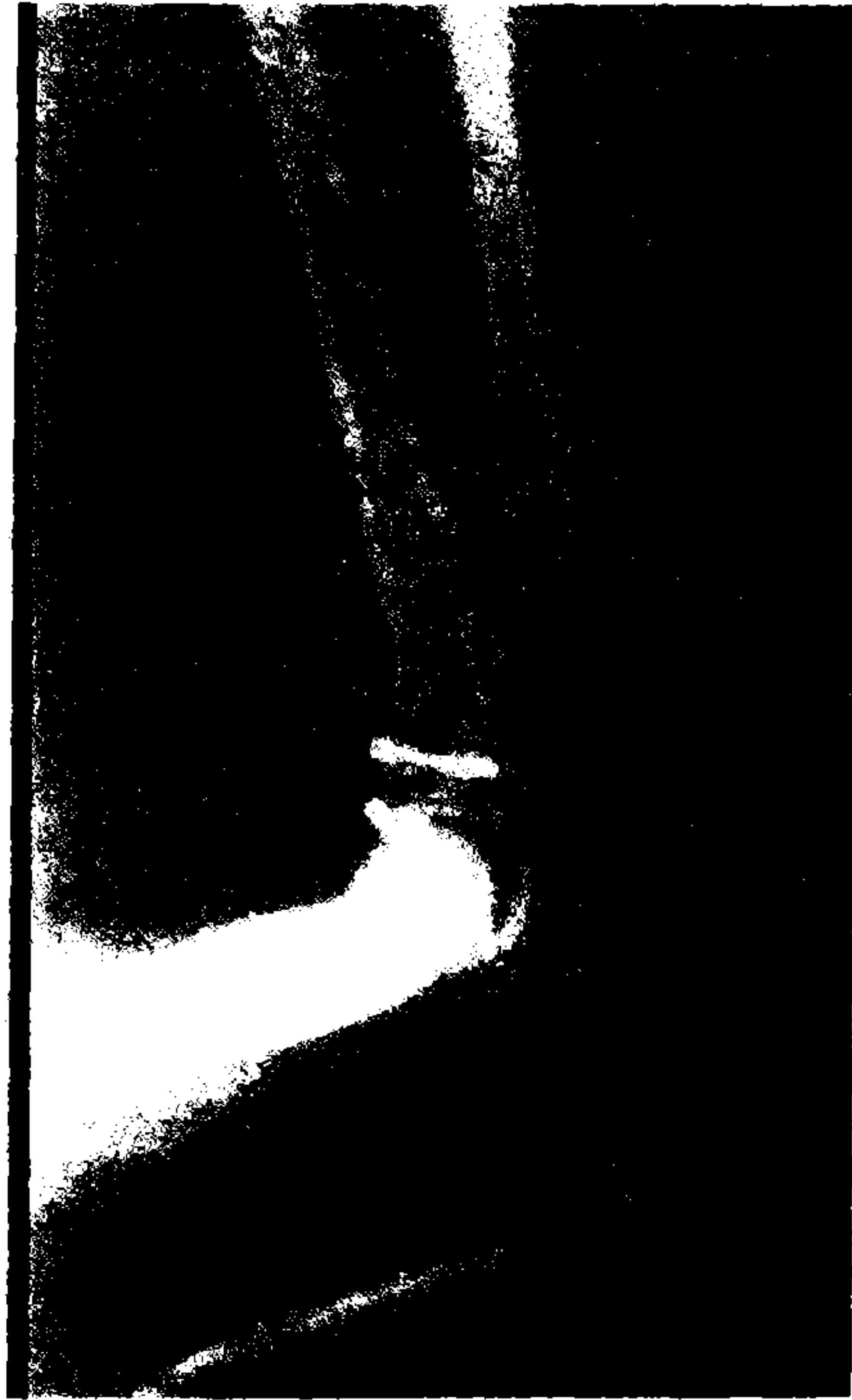
Resim 1-C: Ameliyat sonrası, radius başı ve kapitellum kırıklarının açık redüksiyonu takiben Herbert vidası ile fikse edilmiş hali