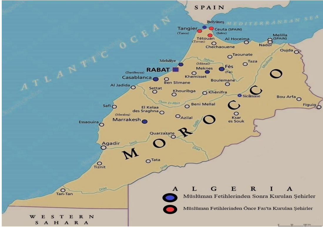
Şekil-1: Fas Şehirleri ve Günümüzdeki Konumları ( https://depositphotos.com/tr/vector/new ).