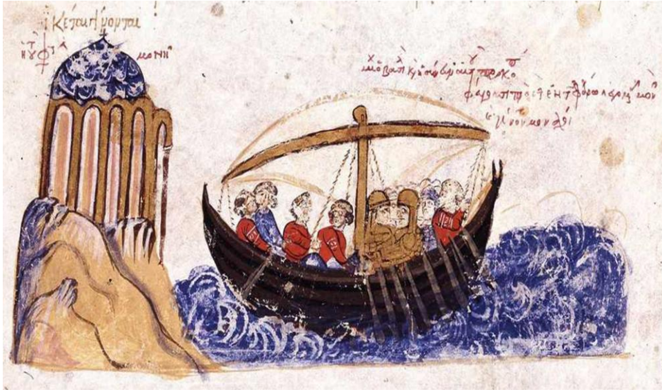
Şekil 1. V. Leo’nun ailesinin Protē Adasına Sürgün Edilmesi (Skylitzes, Fol. 14v)