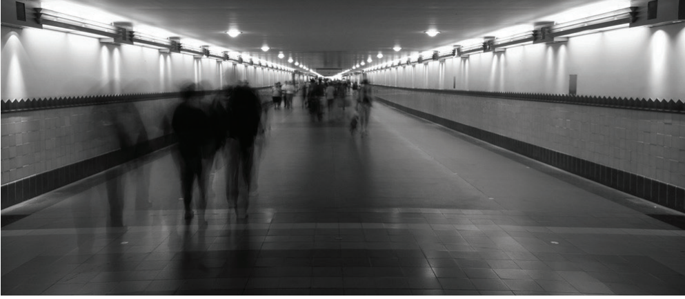
Görsel 3. Yok-Yerler

Auge, “Non-Places” isimli kitabında, yerin üç temel özelliğinden bahsederken “Eğer bir yer, kimlikleyici, ilişkisel ve tarihsel olarak tanımlanamıyorsa bir ‘yok yeri’ tanımlar hale geleceğine dikkat çekmiştir. Bu bağlamda Auge’nin ifadesiyle: