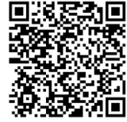
Ek 19. “ Saka Suyu ” Adlı Esere Ait Nota

[https://drive.google.com/file/d/1GCXy_XMBNrvKxjj8f3z5rRBDrlmu42HE/view?usp=drive_link]