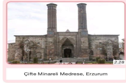
Çifte Minareli Medrese, Erzurum

Türkiye Selçuklu Devleti döneminde inşa edilen darüşşifa veya şifahane olarak bilinen mimari yapılar insanlara sağlık alanında hizmet vermektedir. Alaeddin Keykubat Darüşşifası (Konya), Gevher Nesibe Darüşşifası (Kayseri), Torumtay Darüşşifası (Amasya) (Görsel 2.29) bunlara örnektir.