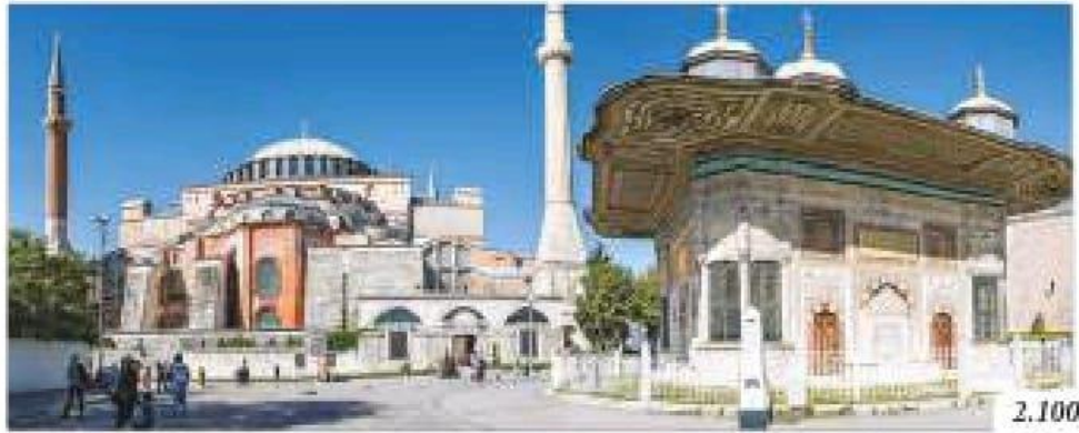
Ayasofya'nın yanına Avrupa mimarisi etkisiyle Lale Devri'nde inşa edilen III. Ahmet Çeşmesi

Sosyal hayatta vakıfların yeri konusunun anlatımında insan ilişkilerine değinildiğinden sosyolojiden yararlanılmıştır. İfade şöyledir;