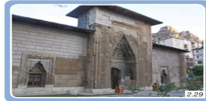
Torumtay Darüşşifası, Amasya

Türkiye Selçuklu Devleti döneminde inşa edilen darüşşifa veya şifahane olarak bilinen mimari yapılar insanlara sağlık alanında hizmet vermektedir. Alaeddin Keykubat Darüşşifası (Konya), Gevher Nesibe Darüşşifası (Kayseri), Torumtay Darüşşifası (Amasya) (Görsel 2.29) bunlara örnektir.