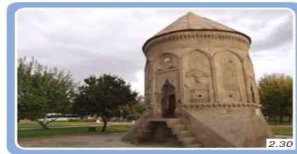
Döner Kümbet, Kayseri

Türbe ve kümbetler bu dönemde yapılmış önemli mimari eserlerdir. Bu yapılar birer anıt mezardır. Türbe ve kümbetler tek başına bir eser olarak yapılabildiği gibi cami ve medreselerle beraber de inşa edilmiştir. Mevlana Türbesi (Konya) ve Döner Kümbet (Kayseri) (Görsel 2.30) bu yapılarla örnektir.