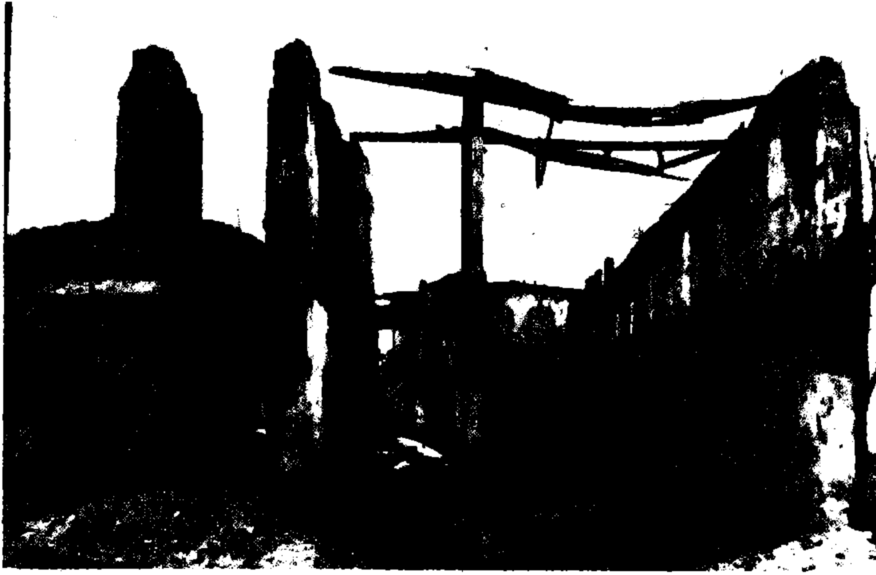
Resim IV : 1980'li yıllarda Edirne Merkez Asker Hastanesi.