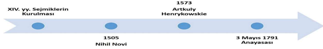
Şekil 1: Birinci Dünya Savaşı'na Kadar Polonya'daki Anayasal Gelişmeler