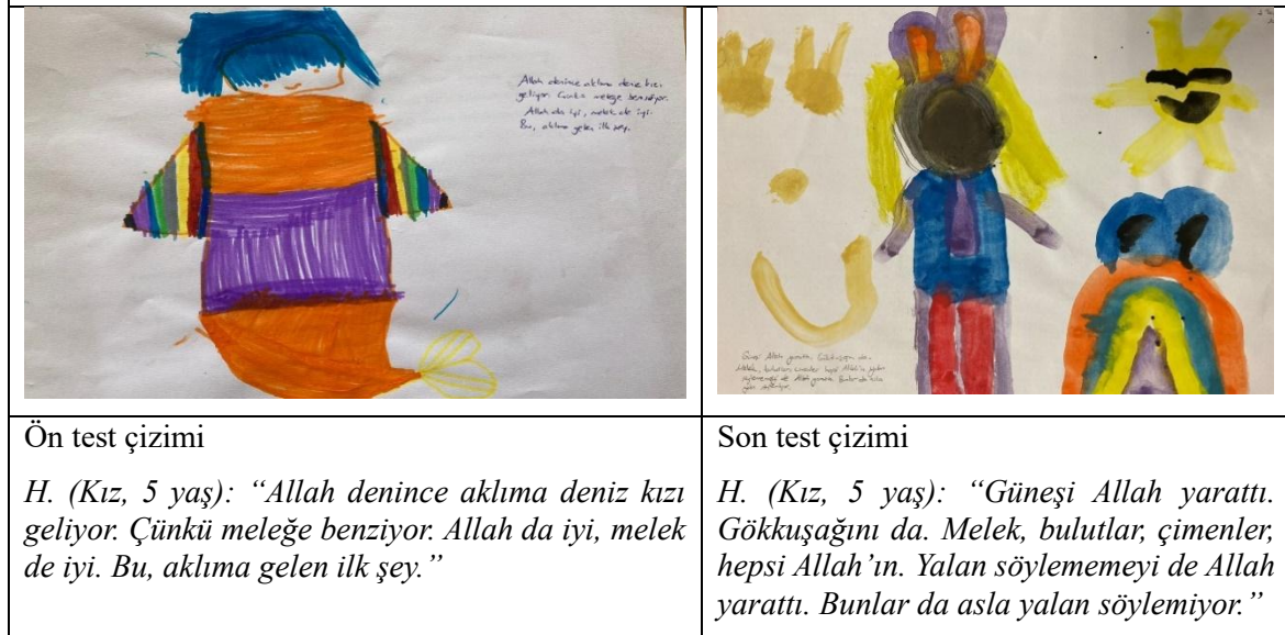
Şekil 1: Çocukların Allah hakkında ön test ve son test çizimleri.

Çocukların ön test ve son test anket cevapları ile Allah hakkında çizdikleri resimlerden 3 tanesinin kısa analizi aşağıda sunulmakla birlikte, bibliyoterapi oturumlarının çocukta Allah tasavvurunun olgunlaşmasına hangi yönde etki ettiği hakkında bilgiler yer almaktadır.