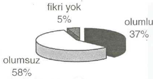
Grafik.3. İşletmelerin Banka Kredisine Bakışları

Kredi kullanmayan işletmelere finansman ihtiyaçlarını nasıl karşıladıkları sorulmuş ve bu işletmelerin %60'ı finansman sıkıntısı çektikleri zaman yurt dışında çalışan kişilerden borç para aldıklarını belirtmiştir. %40'ı ise yurt dışından borç para almadığını belirtmiştir. Ayrıca, yurt dışında çalışan kişilerden ödünç para almayan ve kredi kullanmayan işletmelerin %53'ü ise finansman sıkıntısı çektikleri zaman arkadaşlarından borç para aldıklarını belirtmişlerdir. Kredi kullanmayan işletmelere; finansman sıkıntısı çektiğiniz zaman bankadan borç para almayı mı? yoksa yurt dışında çalışanlardan borç para almayı mı? tercih ederiniz diye sorulmuştur. İşletmelerin %33'ü banka, %40'ı ise yurt dışından borç para almayı, %29'u ise diğer cevabını vermiştir.