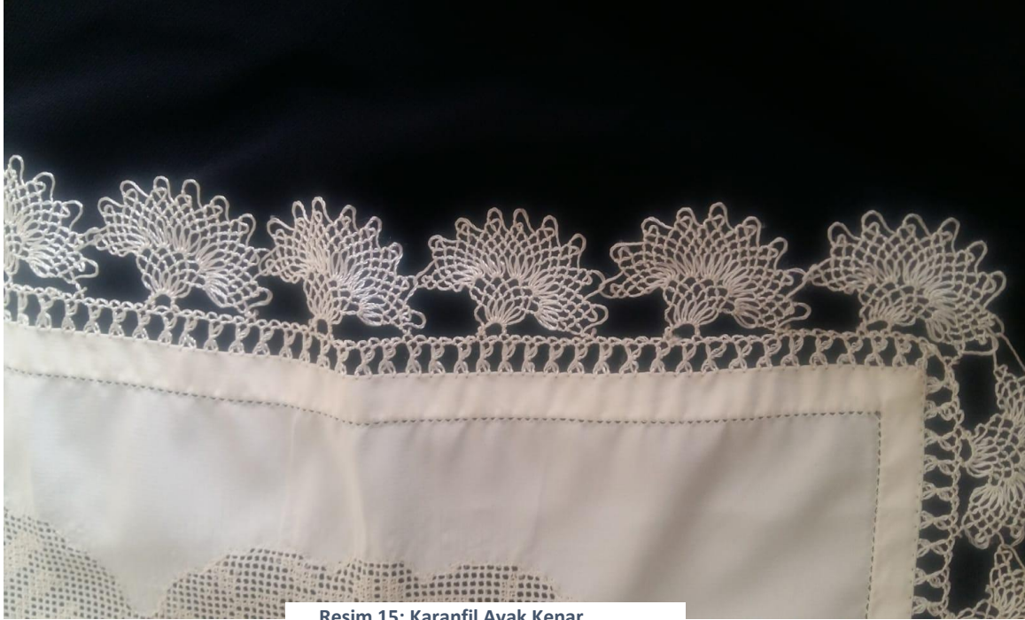
Resim 15: Karanfil Ayak Kenar