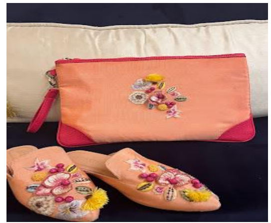
Resim 13: Kutnu kumaşından yapıla çanta ve terlik