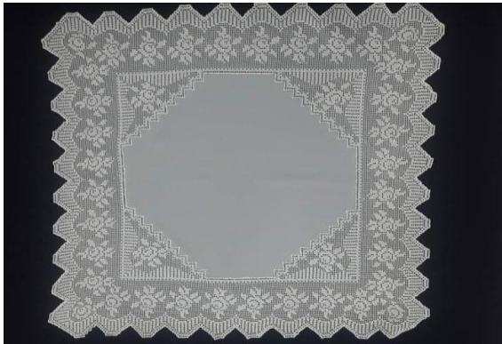
Resim 16: Güllü Antep İři Nakışı