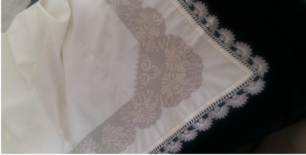
Resim 14: Büyük Marulu Mevlüt Dolağı