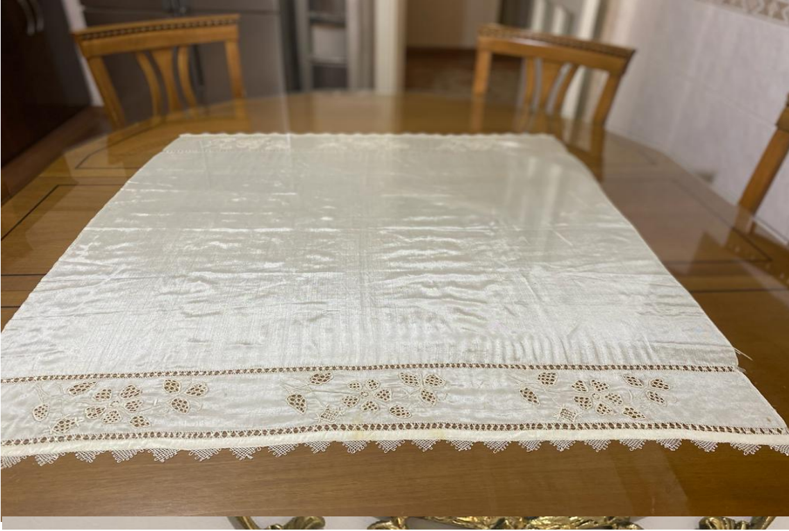
Resim 18: Fil İři Modeli