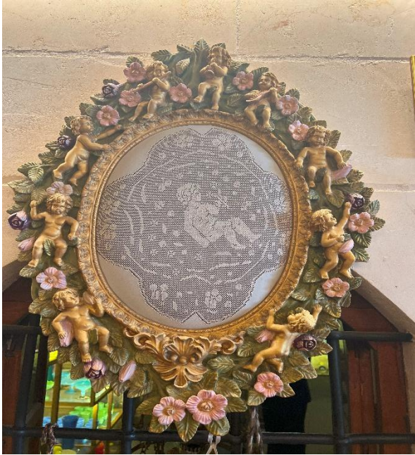
Resim 7: Bebekli Model Antep işi nakışı