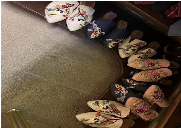
Resim 12: Kutnu kumaşından yapılan ayakkabı