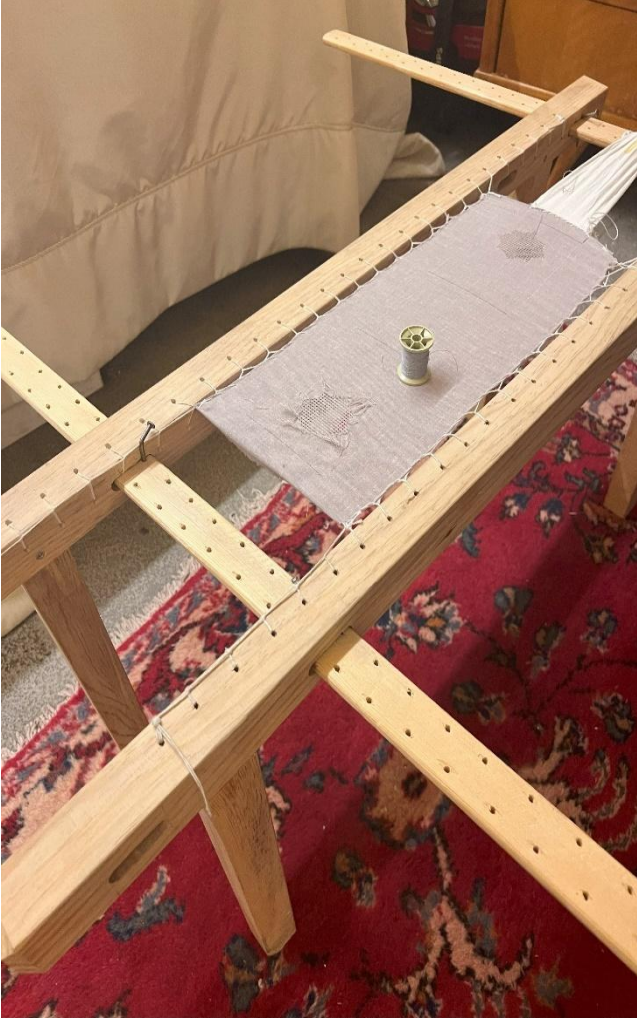
Resim 1: Antep işi nakışının işlendiği kergah