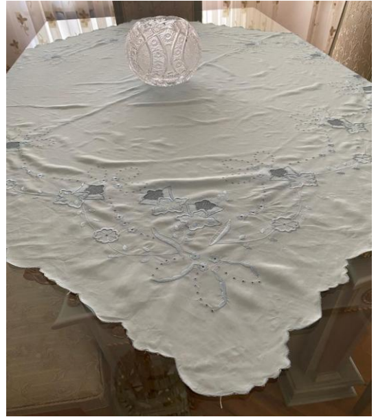
Resim 11: Bir kısmı makine ile bir kısmı el işi ile yapılmış delik işi modeli