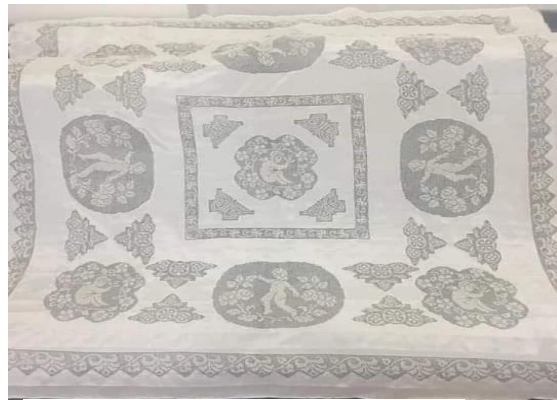
Resim 17: Bebekli Motif