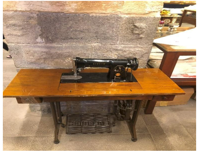
Resim 3: Nakışların işlendiği Karabaş adı verilen makine