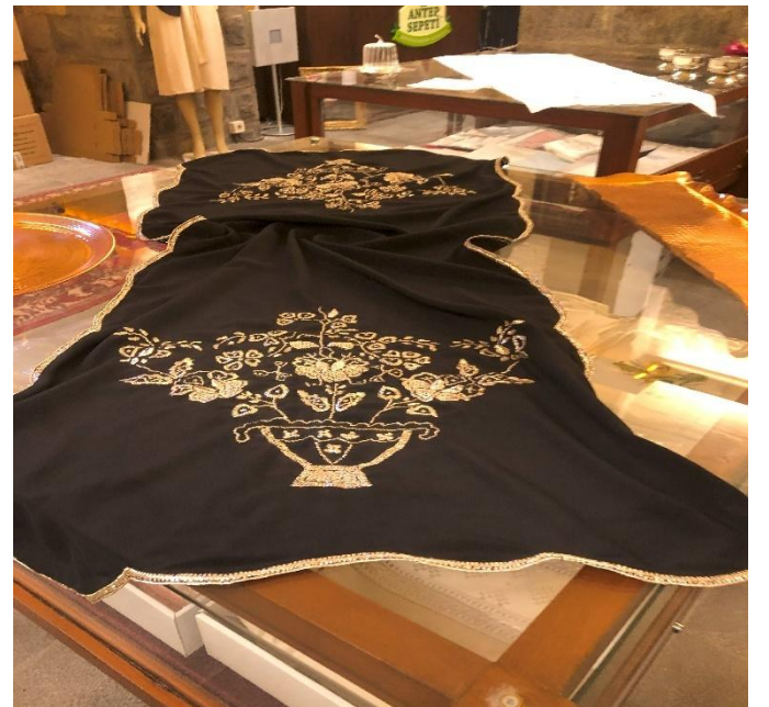
Resim 5: Bartın yöresinden esinlenen Antep işi takımı (tel kırma modeli)