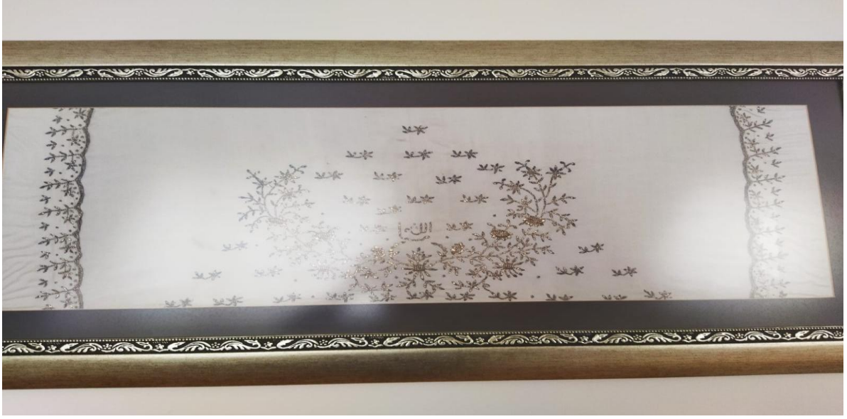
Resim 9: Altın işleme Antep işi nakışından mevlüt tülbentinin tablo hali