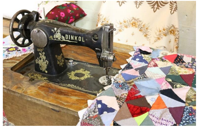
Resim 2: Nakışların işlendiği makine