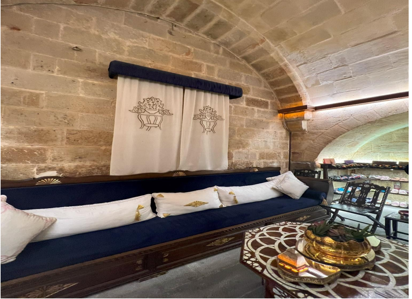
Resim 6: Antep işinin kullanım yerlerinden birisi olan kutnu kumaşından yapılan perde