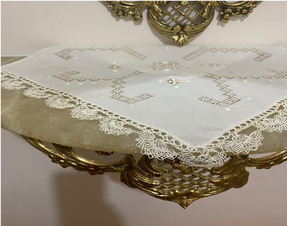
Resim 19: Bademli Cięerdeldi Modeli