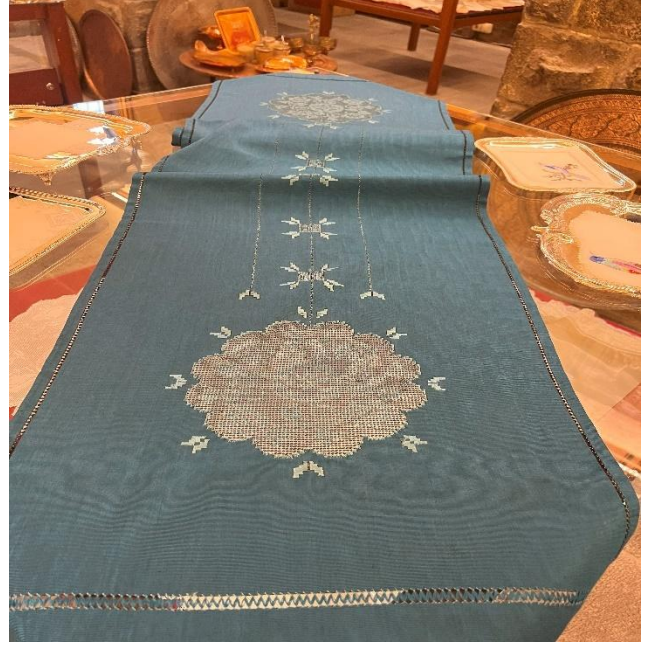
Resim 8: Günümüz modern şartlarda Antep işinin renkli kullanımı