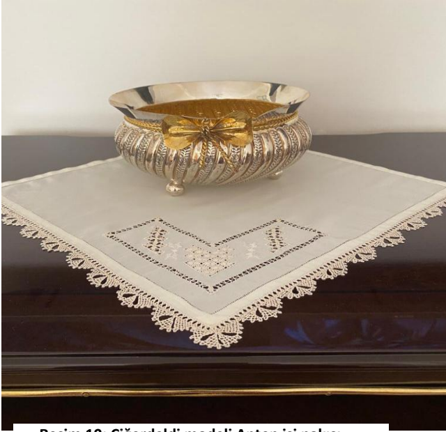
Resim 10: Çiğerdeldi modeli Antep işi nakışı