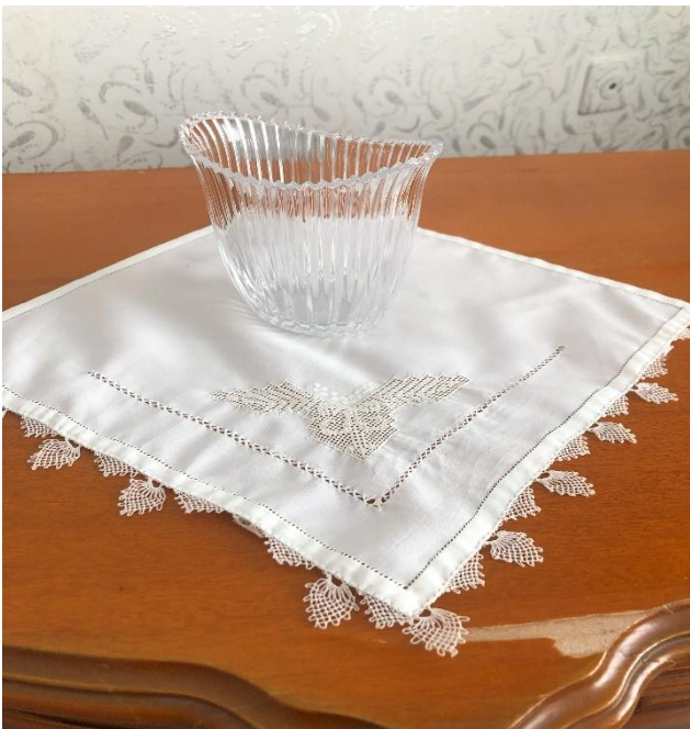
Resim 4: Antep işi nakışı yarım kelebekli motifli